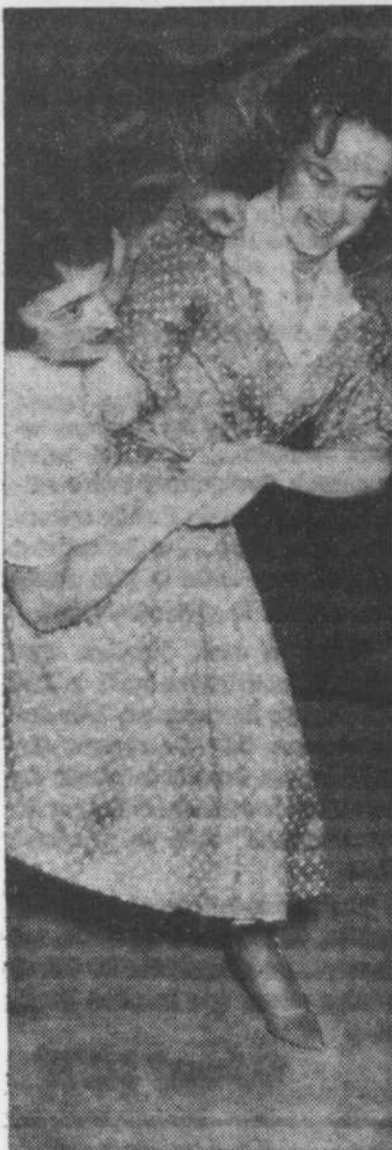
Les deux soeurs pratiquant une nouvelle prise de judo.

plus sur les soeurs Bédard? Sans doute, nous avons oublié plusieurs détails, mais nous y reviendrons sûrement un jour!