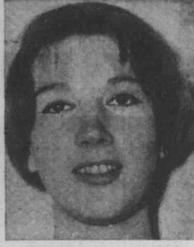
Le reporter a fait un pudding