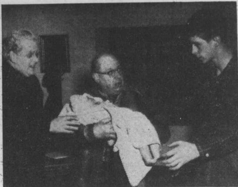
Le brave curé qui fut toujours pour les familles nombreuses se fait des réflexions en gardant les cinq enfants d'une paroisse...

"Seigneur s'il est tout entendu que nous, les prêtres iront au ciel, où donc les mettez-vous les mères de famille?"