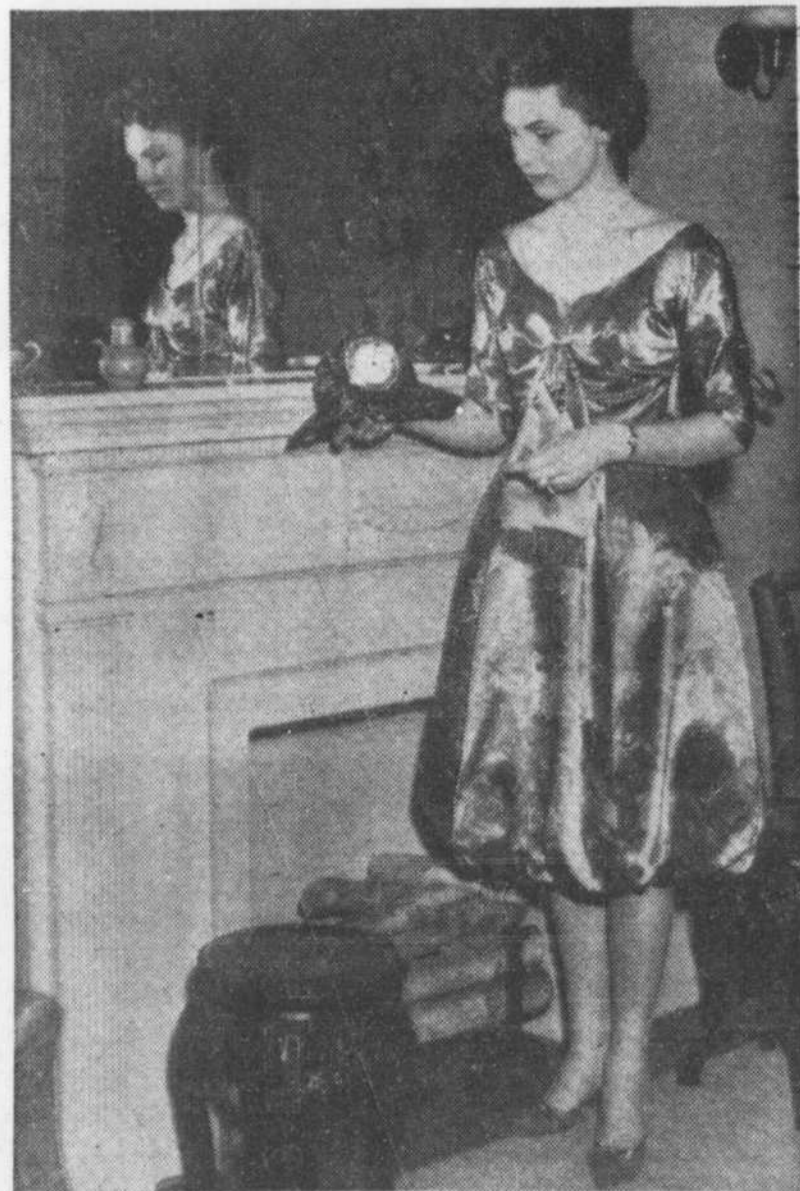
Rien n'est précieux comme le temps pour la co-directrice de LouEllen Productions. En attendant de se rendre à un coquetel, Louise consulte l'heure. Nul doute que, dans une aussi jolie robe, ce sera son heure ! La toilette est coupée dans un lourd satin bleu de Roy, avec impression de fleurs plus pâles.