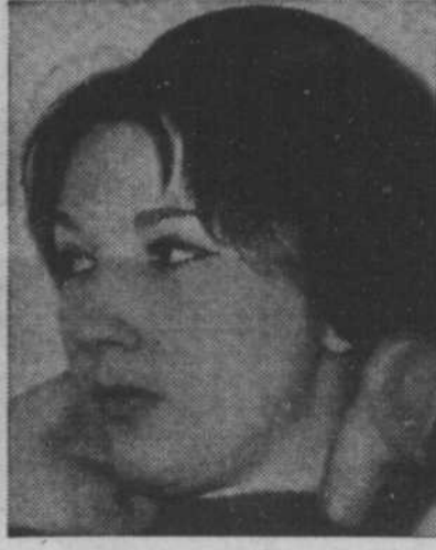
Je lui ai parlé en français