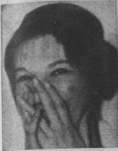
Je ne parle pas anglais