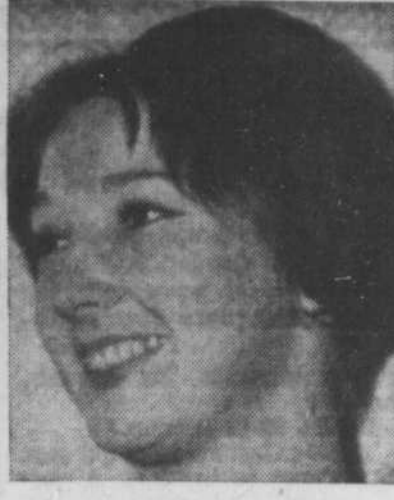
Avoir fait le tour du pays?...