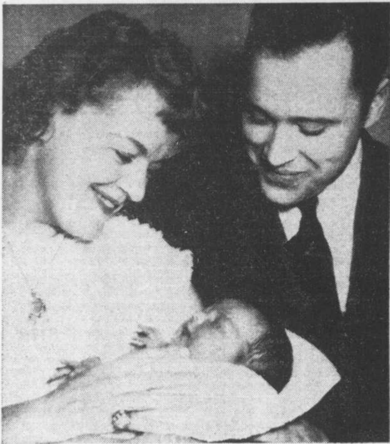
Cette saisissante photo se passe de commentaire...

médiatement: "Elle s'appellera Caroline."