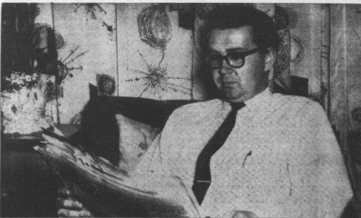
Retiré chez lui avec sa petite famille, le journal et la TV demeurent ses seules sources d'information.