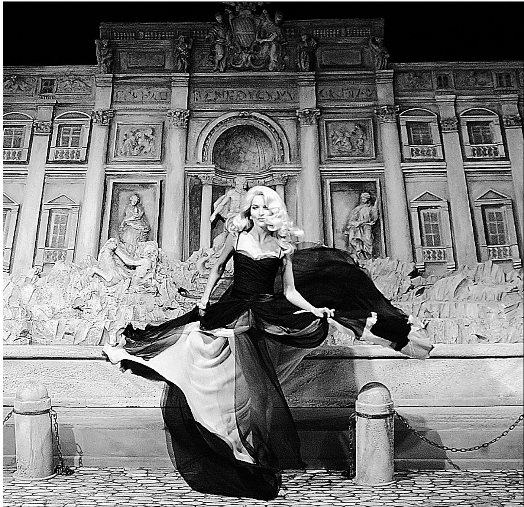
La Dolce Vita de Fellini, a inspiré les designers Domenico Dolce et Stefano Gabbana pour leur défilé de la collection automne-hiver 2004, présenté à Milan en janvier.

C'est la naissance de la dolce vita : la chronique rose débarque pour la première fois à la une des journaux et ne l'a pas quittée depuis.