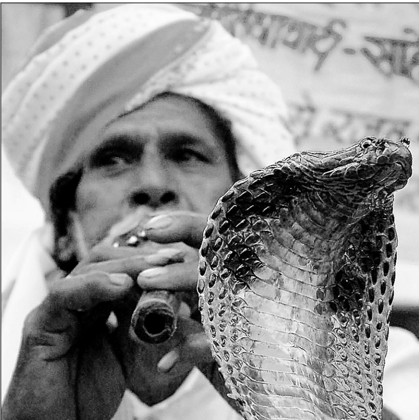
Une loi adoptée en 1972 a poussé la plupart des charmeurs hors des villes, par peur de se faire arrêter par la police, les renvoyant dans les villages où ils gagnent beaucoup moins.