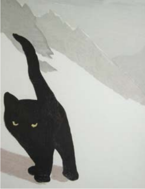
«L'horrible chat des neiges» Bois gravé Albert Dumouchel (1969)