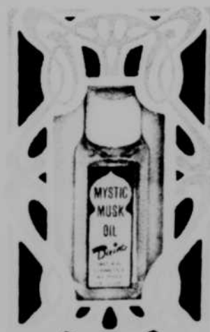
Flacon 9.95 - 2 pour $18.00

Ce mystérieux Parfum ne séduit pas seulement par son odeur agréable. (très personnelle puisqu'elle s'intègre à votre personne, et varie suivant celui ou celle qui l'utilise). Il semble exercer une attirance secrète, sensuelle et envoûtante à laquelle personne ne peut RÉSISTER! On affirme que celui ou celle qui utilise ce parfum subtil et grisant dégage une senteur troublante qui attire IRRÉSISTIBLEMENT hommes ou femmes, il agit comme une vertu magique, tous vos désirs deviennent réalité.