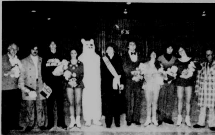
Le "bonhomme ours polaire", la Reine, et la troupe de patineurs de la Caravane des Champions.