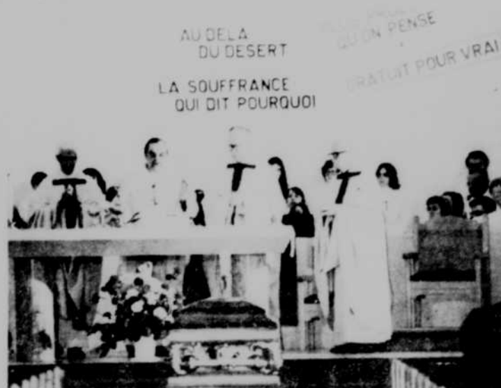
C'est en l'église de Ste-Adele qu'a été célébré le service funèbre...