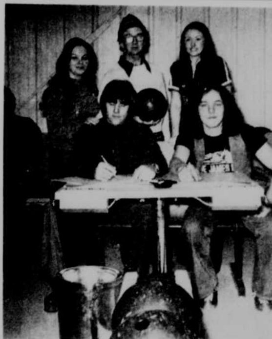
Il y a eu aussi une partie de bowling mettant aux prises les travailleurs et les artistes. Sur notre photo, y'a un capable qui écrit les points les yeux fermés.