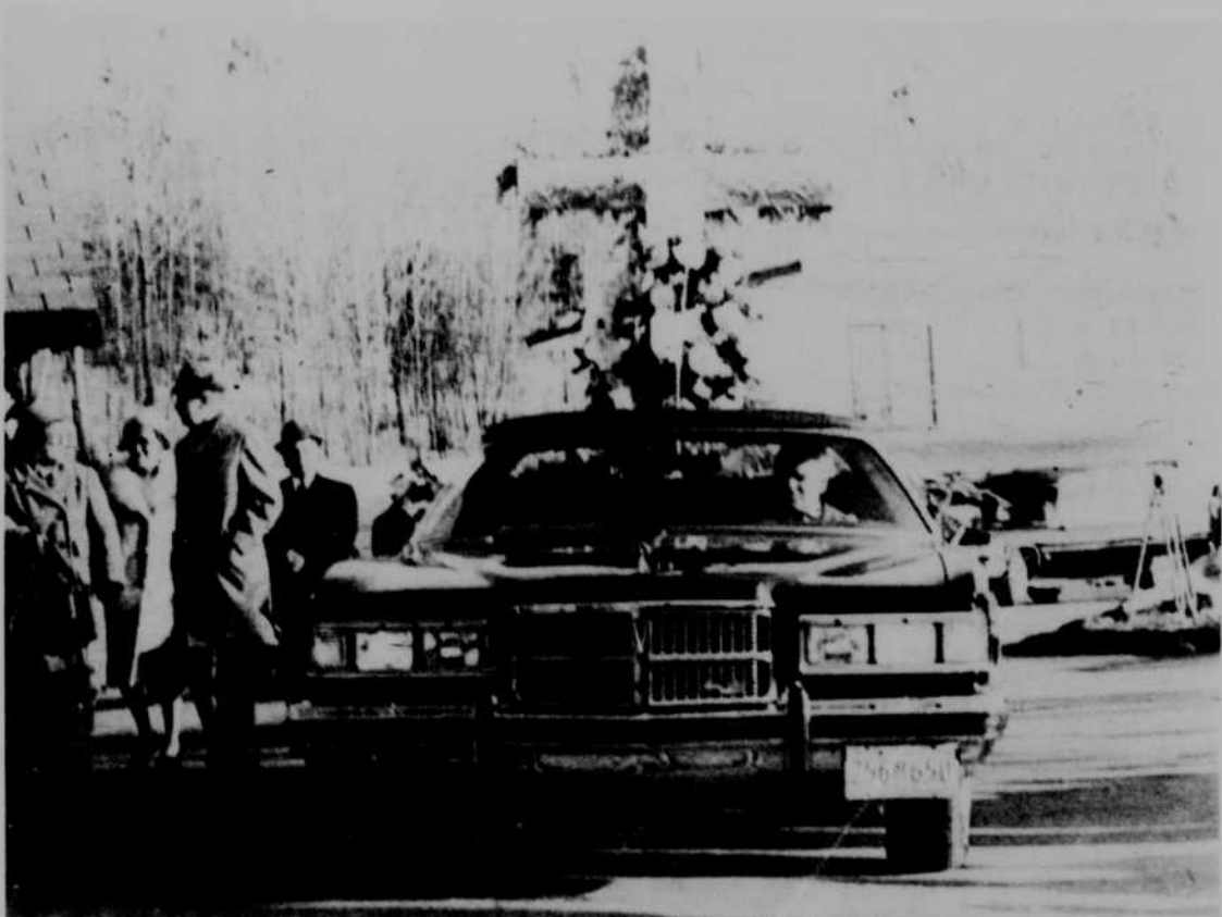
Après le service à l'église, le convoi funèbre a porté la dépouille mortelle de Claude-Henri Grignon au cimetière de Ste-Adele où elle fut inhumée.