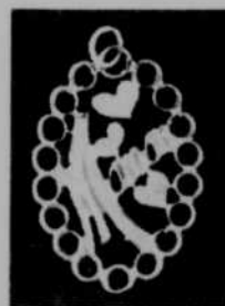
$15.95 — H —

NOS PHOTOS SONT GRANDEUR NATURELLE VOUS POURREZ DONC COMPARER FAIRE PARVENIR DATE DE NAISSANCE POUR ZODIAQUE