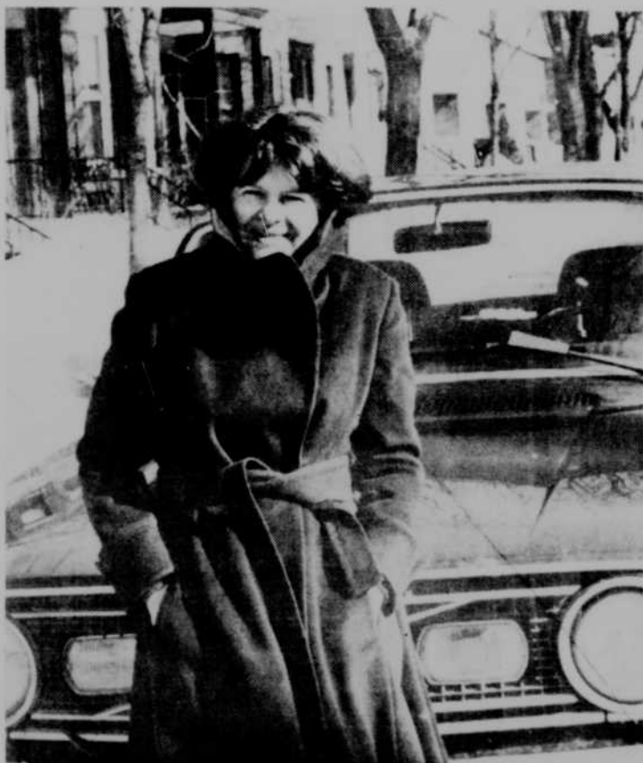
"Je me dégage de plus en plus de cette petite maison d'Outremont..."

—Non, je suis née en ville, mais nous allions souvent à la