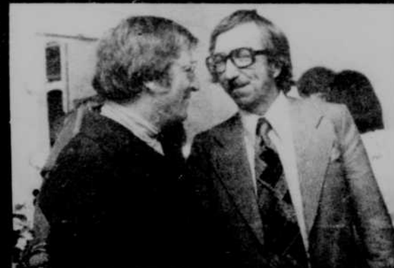
Forcément, Pierre Péladeau, président de Québecor Inc, est venu saluer son "annonceur" du Journal de Montreal.