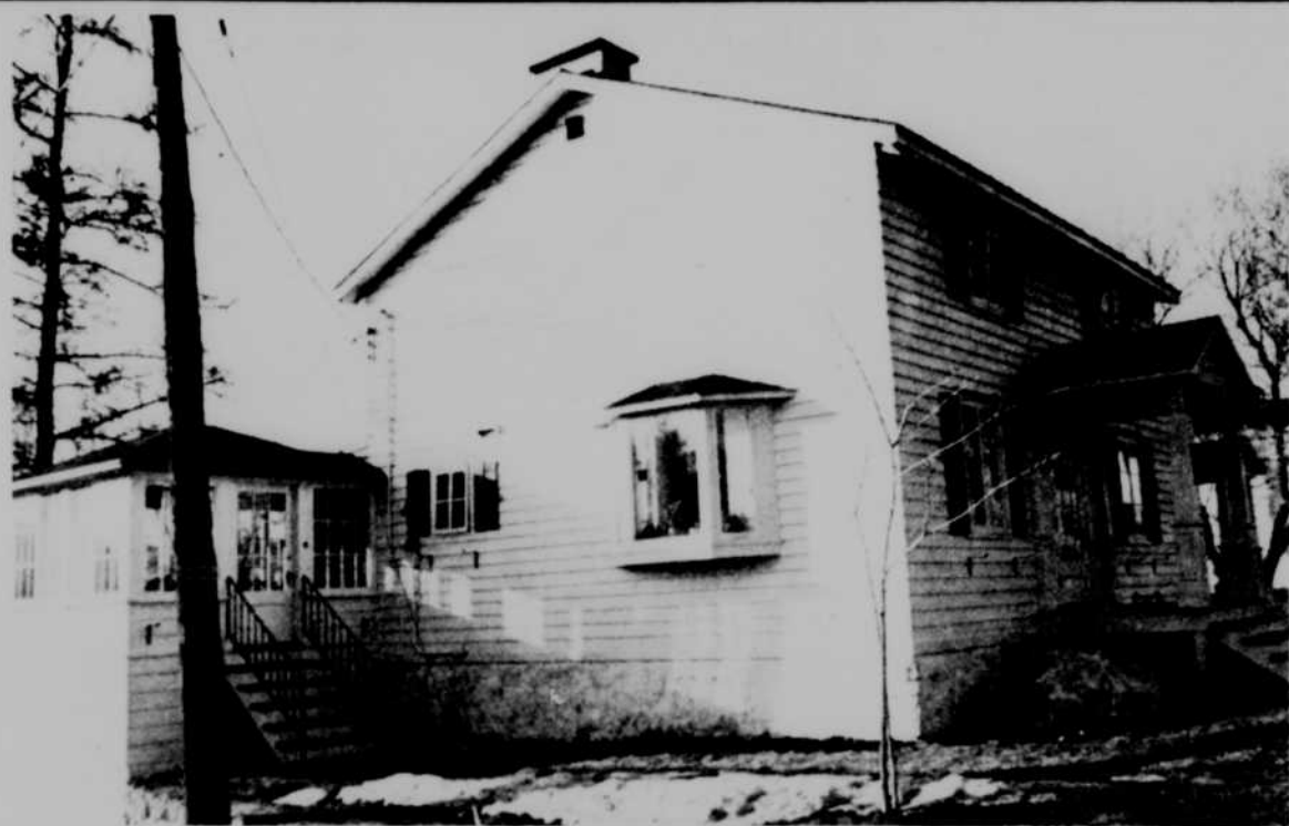
C'est dans cette maison de Ste-Adele que Claude-Henri Grignon a terminé ses jours...