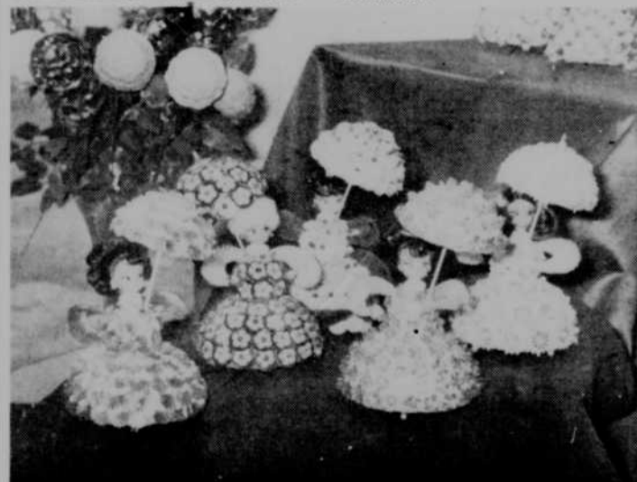
Ces poupées qui deviennent des porte-bonheur pour les artistes de la colonie.

"A deux pas du canal 10 et de Radio-Canada, nous faisons des affaires d'or justement parce que les artistes adorent le bricolage. Deux grandes vedettes qui veulent garder l'anonymat ont acheté des poupées à leurs enfants encore hier. Dans la colonie artistique, nos poupées deviennent des porte-bonheur!"