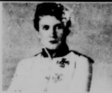
Le rôle du Duc de Reichardt dans "L'Aiglon" de Rostand est l'un de ceux dont elle garde le meilleur souvenir.

Toutefois, elle refuse d'appeler "sacrifice" les refus d'engagements qu'elle donna comme comédienne alors