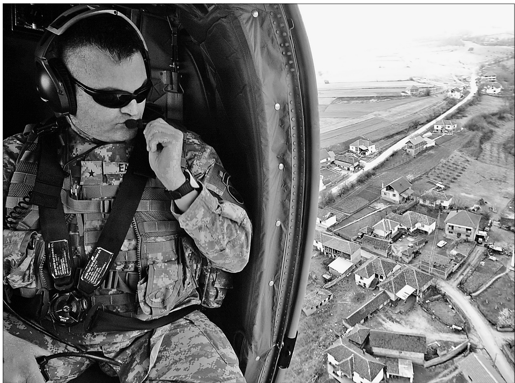
Le général Douglas Earhart, commandant de la force américaine du maintien de la paix au Kosovo, survole le village de Ropotovo (est) au cours d'un exercice. Pas moins de 16 000 soldats de l'OTAN patrouillent le Kosovo, et un déploiement supplémentaire est en cours.

À la suite de la guerre de 1999, le Kosovo, cette province du sud de la Serbie où vit une population à majorité albanaise, a été placé sous la tutelle des Nations unies en attendant que l'on décide de son sort. La semaine dernière, un émissaire de l'ONU a proposé que la province accède à l'indépendance – un scénario rejeté avec véhémence tant par la minorité serbe au Kosovo que par Belgrade. La Presse s'est rendue sur place la semaine dernière alors que le Conseil de sécurité entreprenait des discussions finales sur cette question potentiellement explosive.