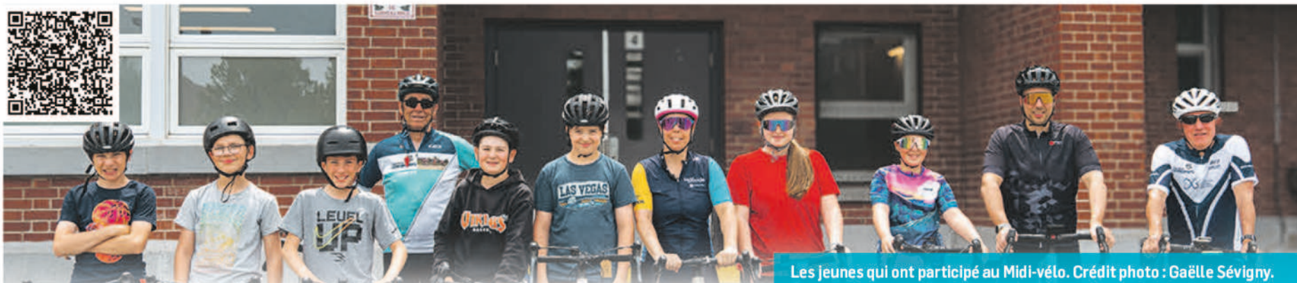
Les jeunes qui ont participé au Midi-vélo.