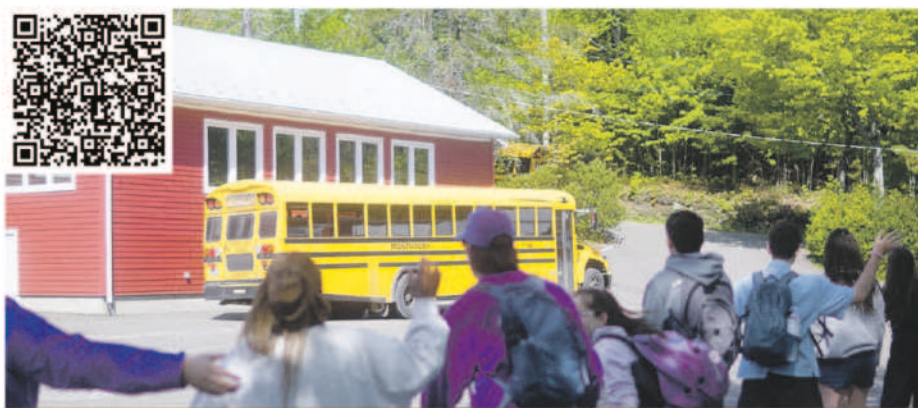
Les jeunes au Camp Trois-Saumons dans le cadre du Camp Odysée.

La campagne de cette année, dont l'objectif est fixé aussi à 10 000 $, est d'ailleurs toujours en cours.