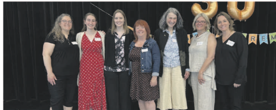
L'équipe d'Apprendre Autrement à la soirée des 30 ans de l'organisme.

Grâce à cette relocalisation favorable à proximité de l'école, les jeunes ont rapidement adopté les lieux, ce qui a mené à une