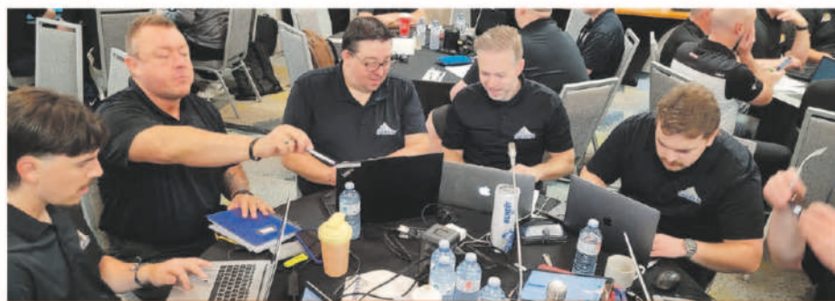
L'organisation de l'Everest lors du repêchage 2026.