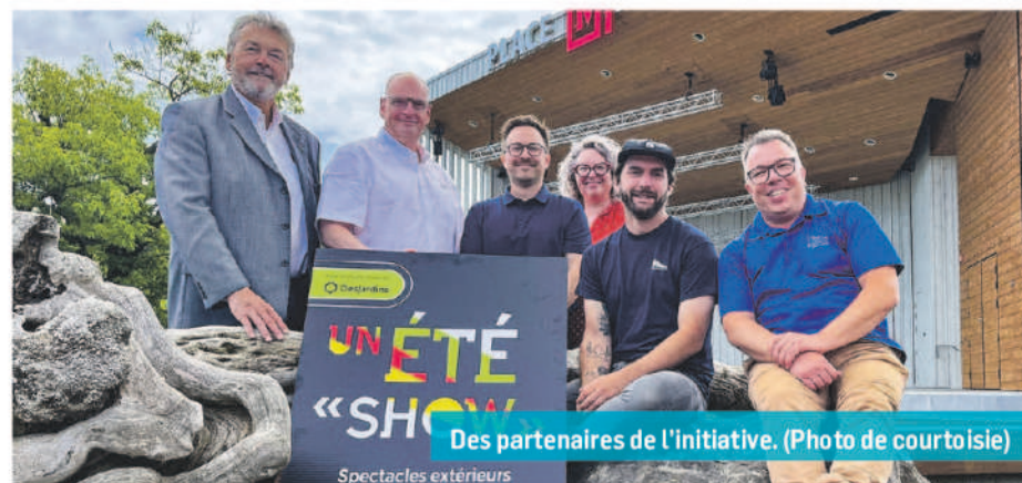
Des partenaires de l'initiative.