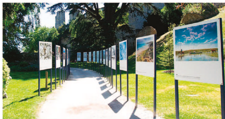
Voici un exemple d'exposition photographique en plein air.