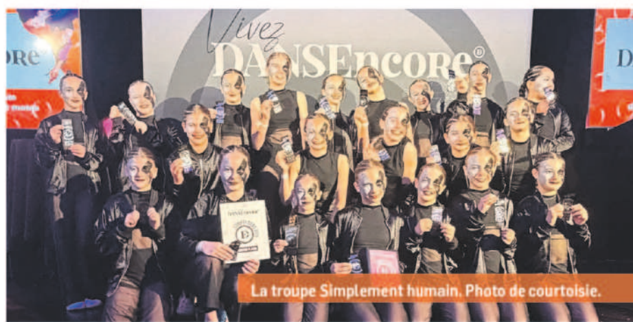
La troupe Simplement humain.