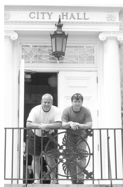
Ce couple homosexuel a parcouru 1500 kilomètres pour se marier au Vermont l'an dernier.

Le Québec a beaucoup évolué, au cours des dernières décennies, pour devenir un des États les plus tolérants au monde en matière d'orientation sexuelle. L'ouverture d'esprit des gens du Québec et la compréhension de ce phénomène, de plus en plus reconnu d'ordre génétique, est en train de porter un coup fatal aux préjugés défavorables envers ceux et celles que la nature a pourvus différemment de la majorité. Les homosexuels de-