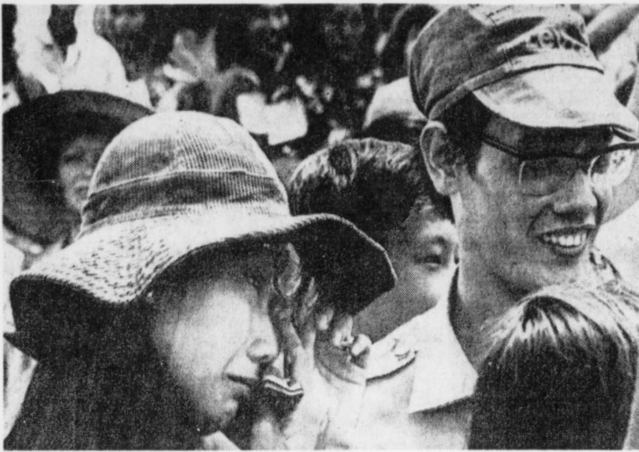
Sourires et pleurs de joie se lisent sur les visages de ce couple de réfugiés vietnamiens autorisés à émigrer aux États-Unis. Ils ont été recueillis par un bateau américain qui les conduit vers la Malaisie d'où ils partiront pour leur pays d'adoption.

GENÈVE (d'après NYTNS et AFP) — On a demandé à un haut responsable vietnamien ce qu'il voulait dire Kurt Waldheim, secrétaire général des Nations unies, quand il a annoncé à la conférence de Genève sur les réfugiés vietnamiens, conférence à laquelle participaient 65 nations, que le Vietnam tenterait d'enrayer les départs "illégaux" pendant une "période de temps raisonnable".