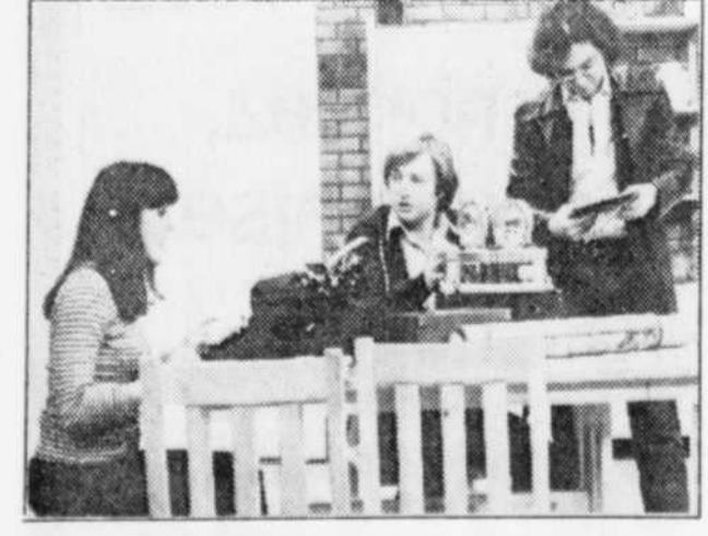
Une scène de la populaire émission "Dominique"