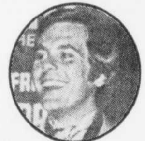
Pierre Lalonde meneur de jeu à l'émission "The Mad Dash"