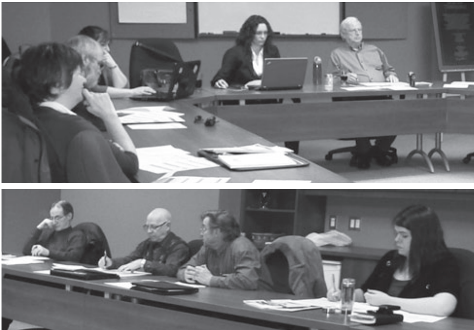
Les membres de la Commission régionale sur la ruralité au travail.

Le mémoire a été présenté, corrigé et approuvé par les membres du conseil d'administration de la Conférence régionale le 16 février dernier. Il est disponible le site Internet.