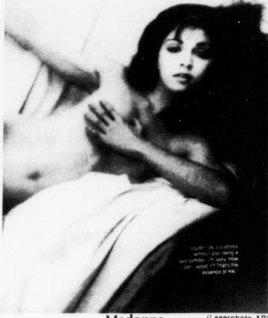
Madonna

Pendant ce temps, Katrina Leskanitch et le bassiste Vince de la Cruz présentent leurs chansons aux soldats stationnés dans les bases militaires aux États-Unis.