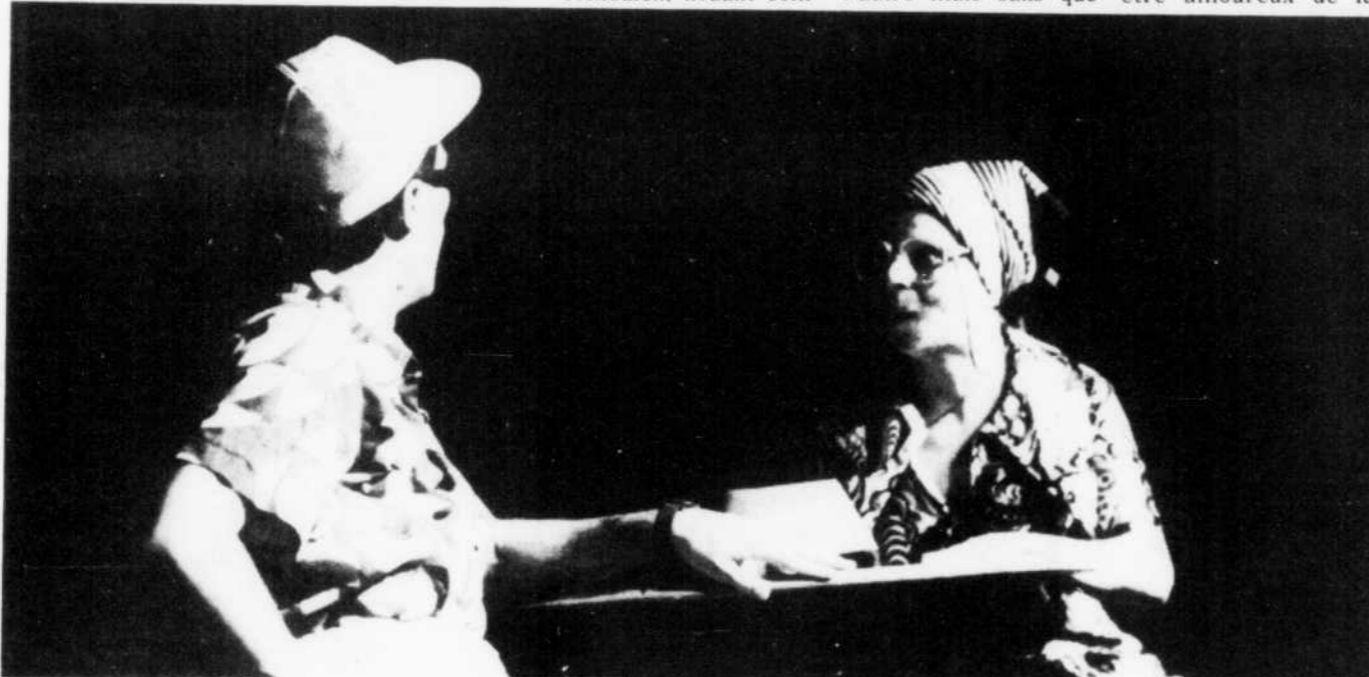
Un excellent moment à l'Auberge Bromont avec Victor et Violette, préparant leur sortie au théâtre.