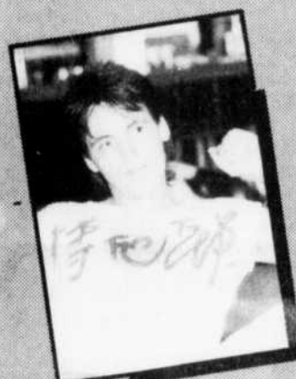
Guy A. Lepage