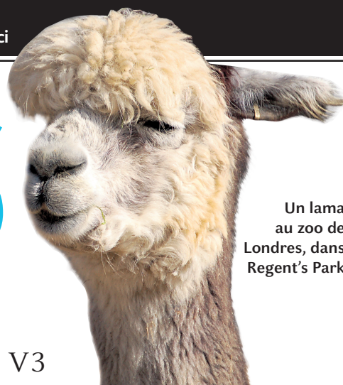
Un lama au zoo de Londres, dans Regent's Park

Les parcs royaux de Londres séduisent → V2 et V3