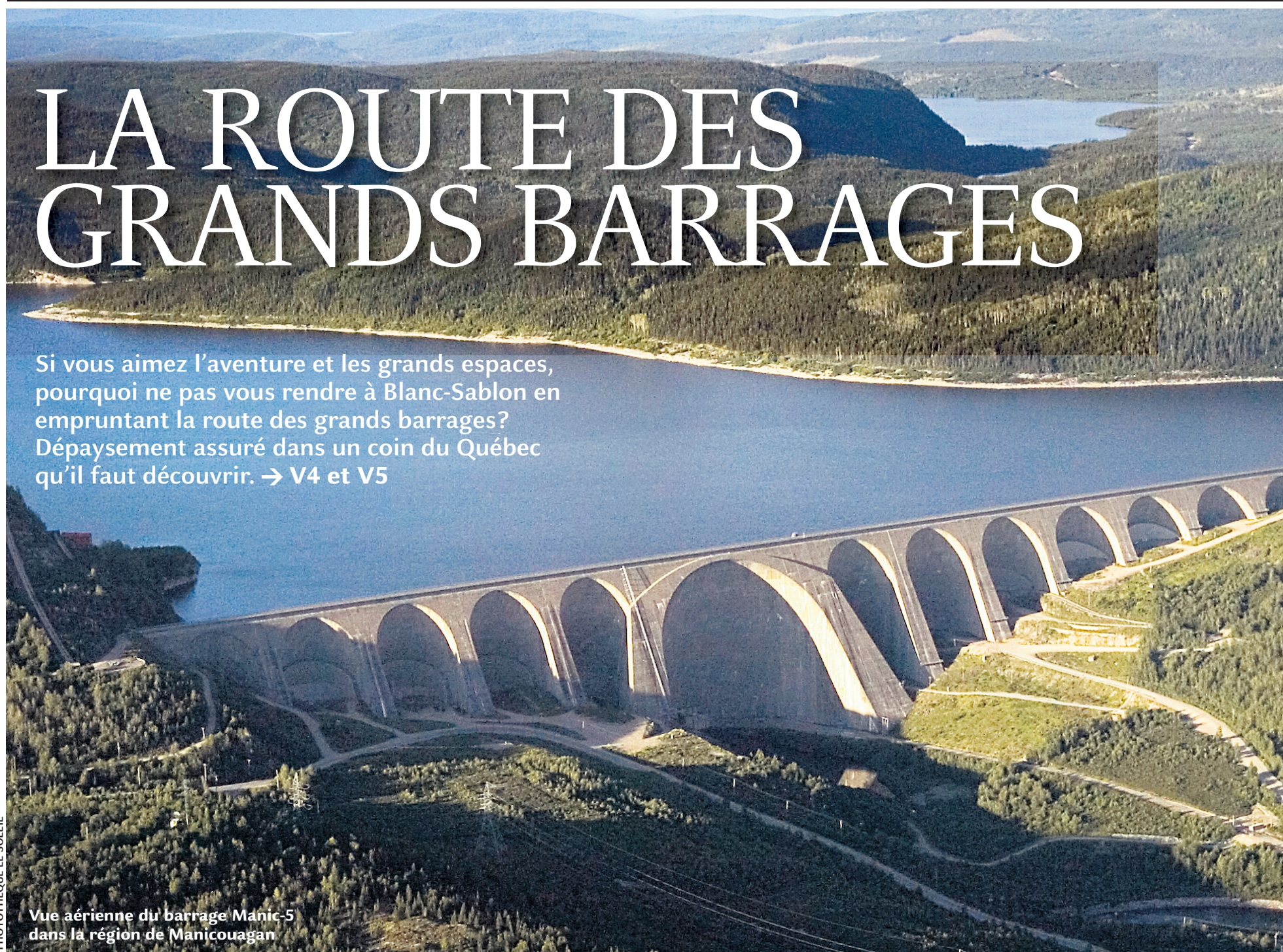
Vue aérienne du barrage Manic-5 dans la région de Manicouagan

Si vous aimez l'aventure et les grands espaces, pourquoi ne pas vous rendre à Blanc-Sablon en empruntant la route des grands barrages? Dépaysement assuré dans un coin du Québec qu'il faut découvrir. → V4 et V5