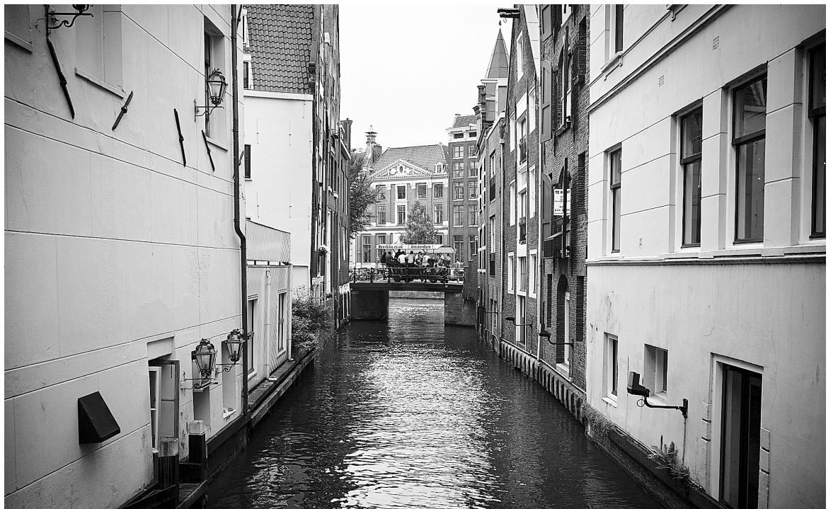
Le musée Grachtenhuis a pour but de faire connaître l'histoire des canaux d'Amsterdam, qui sont inscrits sur la liste du patrimoine mondial de l'UNESCO depuis 2010.

Dans une autre salle du musée, les moments forts de la vie amstellodamoise associés aux canaux, comme la parade de la fierté gaie, défilent sur des écrans panoramiques, tout comme le va-et-vient incessant des bateaux-mouches ou le repêchage, par la police, de dizaines de vélos volés.