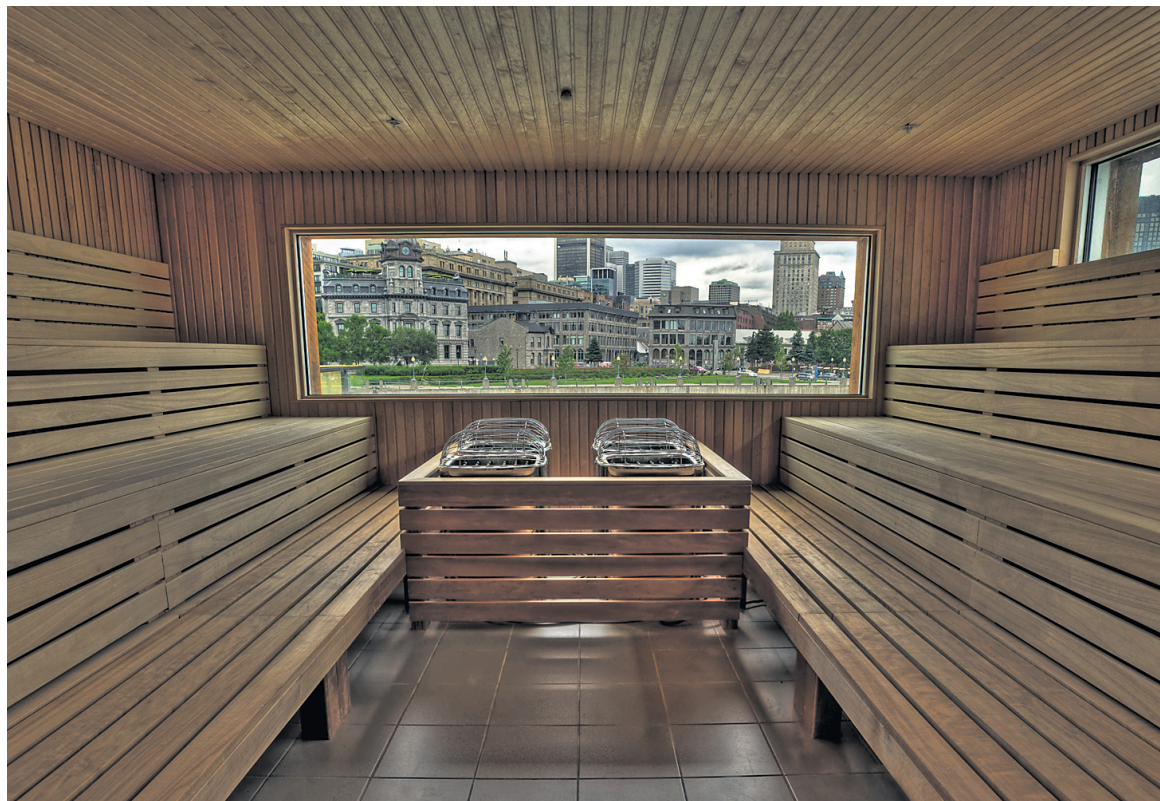
Le Bota Bota, un bateau de 55 mètres qui héberge un spa urbain, est amarré dans la portion est du parc des Écluseurs dans le Vieux-Port de Montréal.

Une fois terminé, ce projet totalisera 10 millions $. Cet été, un bassin d'eau sera rajouté directement dans le fleuve et un quai sera amarré au bateau, pour permettre aux plaisanciers d'avoir accès