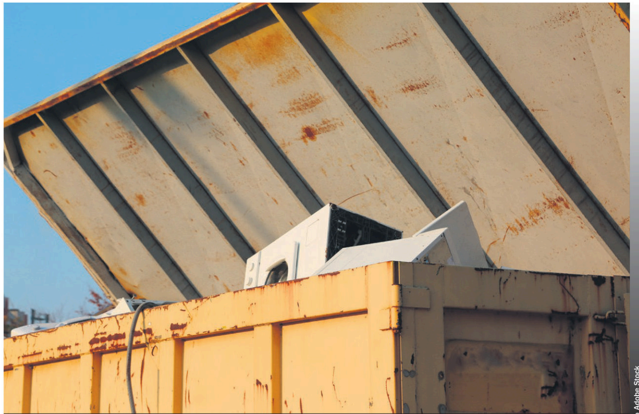
Les citoyens de Nomingue auront eux aussi leur propre écocentre en juillet 2024.

Évidemment une telle infrastructure ne va pas sans coûts. Nomingue estime que l'implantation de l'écocentre