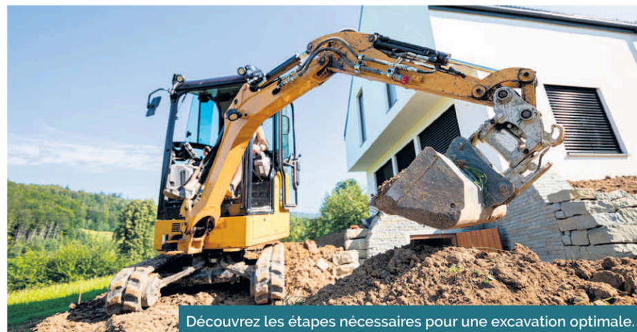
Découvrez les étapes nécessaires pour une excavation optimale.

Par la suite, il sera question de marquer au sol les limites de la future structure ou fondation que vous souhaitez afin de savoir à quel endroit creuser. À cette étape, la profondeur sera également à déterminer. Évaluer le volume de terre qui sera excavé au début du projet vous aidera à prévoir un endroit où déposer celle-ci.