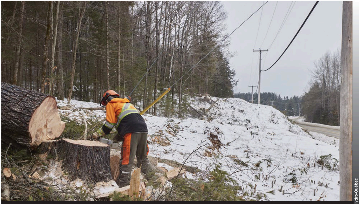
D'ici 2035, Hydro-Québec entend investir entre 155G$ et 185 G$ pour répondre aux besoins croissants tout en améliorant la fiabilité du réseau et la qualité de ses services.

Également, la fiabilité du réseau passera par le remplacement d'équipement ou l'utilisation de nouveaux matériaux plus résistants. «À certains endroits stratégiques, des poteaux de composites seront utilisés, tout comme des protecteurs sur les lignes ou de l'enfouissement léger lorsque c'est possible», précise le vice-président exécutif.