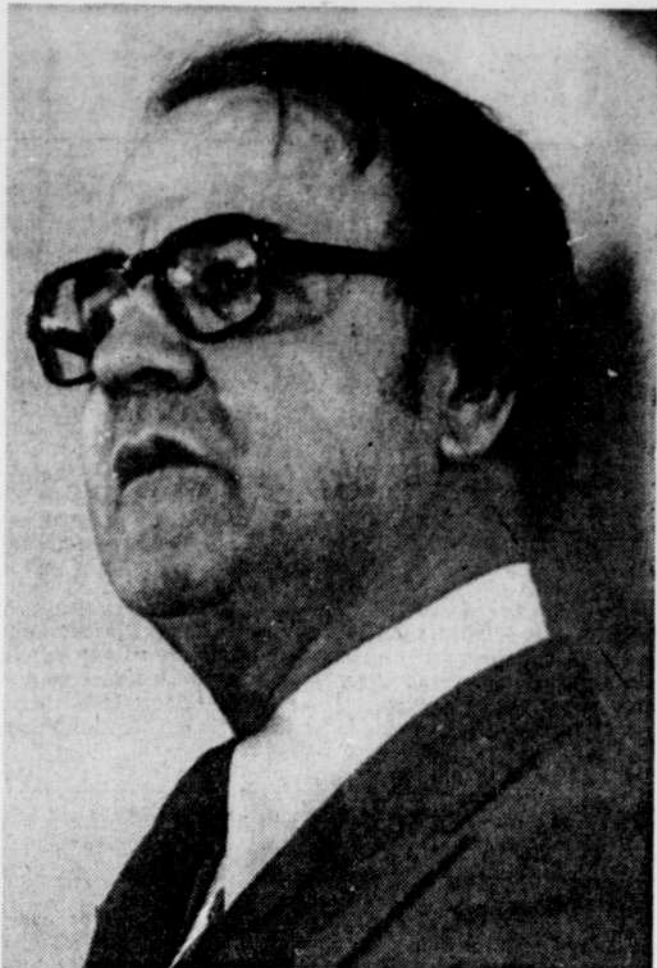
M. Roch LaSalle

Interrogé enfin à propos des prochaines élections générales, M. LaSalle a dit que M. Brian Mulroney, candidat défait à la direction du parti en février 1976, et vice-président de la compagnie minière Iron Ore, serait un excellent candidat "pour n'importe quel comté" et M. LaSalle serait heureux d'une telle candidature.