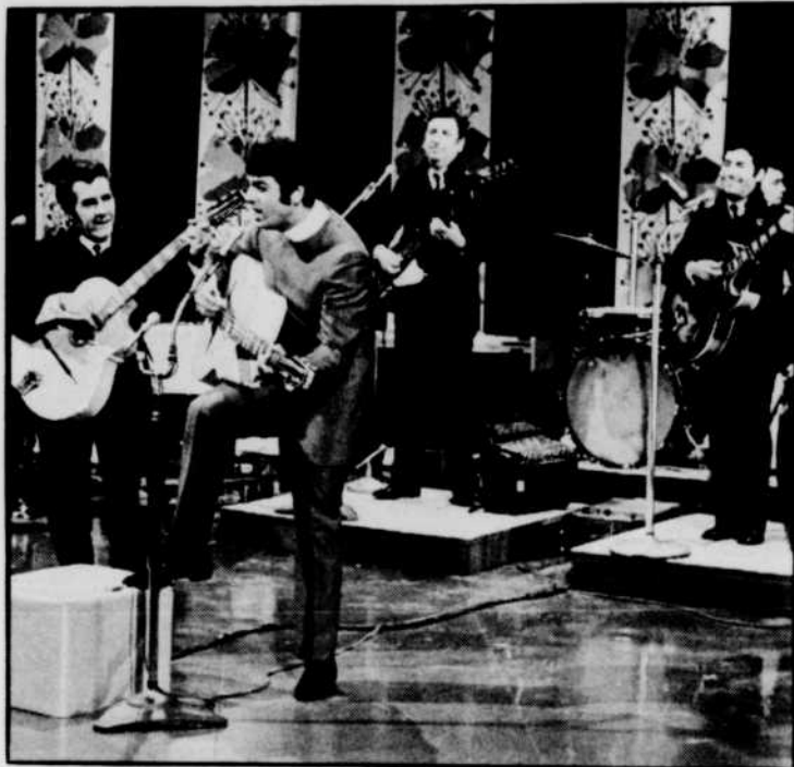
Enrico MACIAS et son orchestre.

Adopté par Paris «qui l'a pris dans ses bras», Enrico Macias est né à Constantine, en Algérie. Dès son tout jeune âge, comme plusieurs de ses camarades, il connaissait un grand nombre de chansons car il aimait chanter avec les siens les refrains transmis à travers les différentes générations de la famille. Ne dit-on pas que chaque Constantinois est un folkloriste-né? Les événements tragiques que nous connaissons obligèrent Enrico à quitter la terre natale. Arrivé en France, il devint en peu de temps le chanteur de la nostalgie, et ses compatriotes pieds-noirs retrouvaient le climat du pays per-