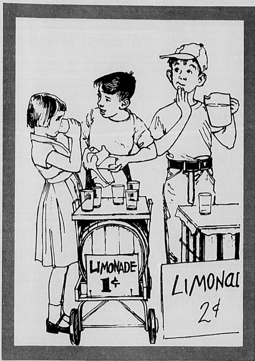
Cette annonce est publiée gracieusement à l'occasion du MOIS DE LA PUBLICITÉ

La publicité, qui permet aux fabricants de se disputer de vastes marchés, les oblige à améliorer sans cesse leurs produits. La somme des petites inventions, des légers perfectionnements qui transforment continuellement les produits de consommation a permis de réaliser une production variée d'une rare qualité. Ces réalisations font l'envie des sociétés où la publicité est moins à l'honneur. La liberté pour le public de choisir et l'obligation pour les fabricants de faire face à la concurrence sont de puissants facteurs de progrès continu.