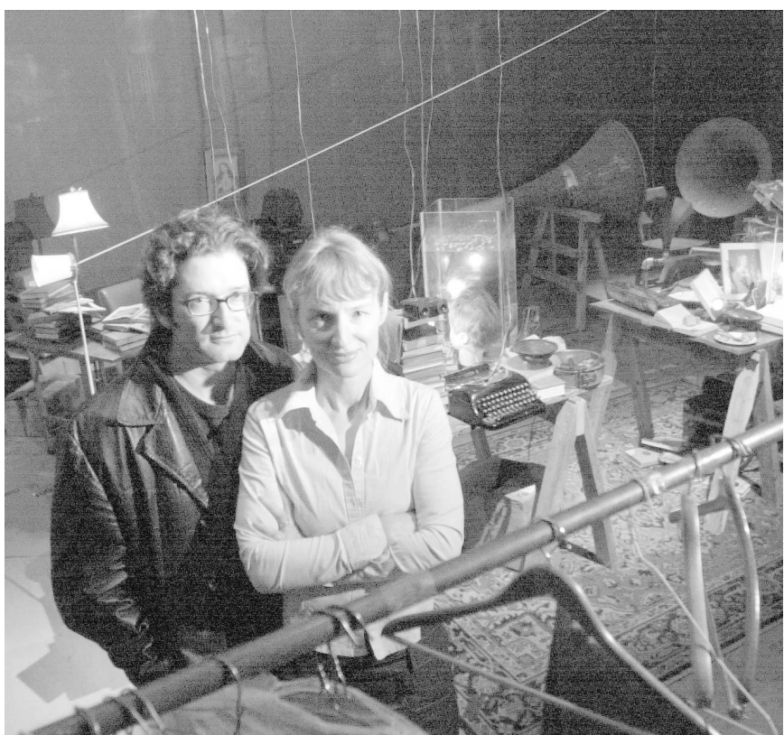
Janet Cardiff accompagne de sa voix (à laquelle se mêle celle de son complice Georges Bures Miller) les visiteurs du MAC qui voudront se prêter au jeu d'une promenade autour de la Place des Arts.