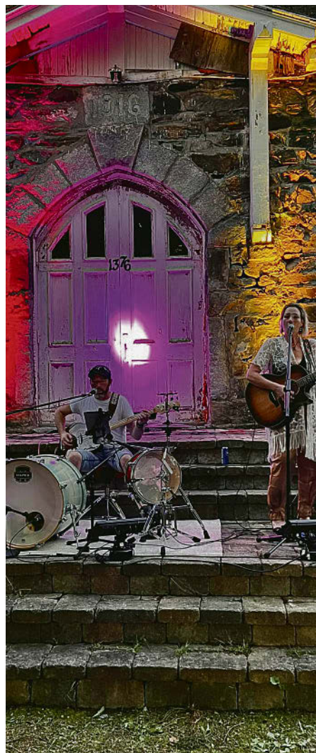
L'an passé, le groupe Crazy Folks s'est produit dans les marches de l'église de Béthanie, dans le cadre des Mardis chauds sur la route .

La Municipalité de Béthanie propose quelques activités à ses citoyens au cours de l'été à venir, en plus de leur offrir le réaménagement de la Place du Centenaire, du côté du centre communautaire.