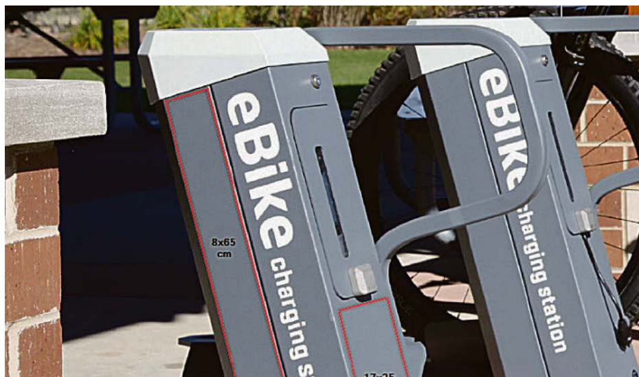
Exemple de bornes de recharge pour vélos électriques.