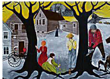
Murale historique du Canton de Roxton par l'artiste Jacinthe Labrecque.

Quant à la murale historique qui avait été réalisée par l'artiste Jacinthe Labrecque et présentement remise, elle sera installée dans ce nouveau parc. Le Canton de Roxton espère compléter ce projet d'ici la fin de l'été. V.L.