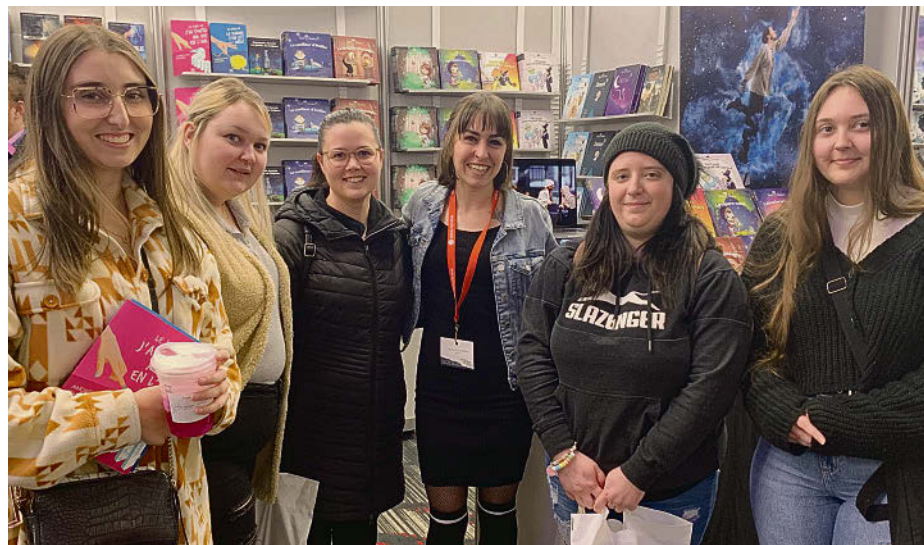
Quelques élèves du Centre d'éducation des adultes Saint-Hyacinthe – Acton en visite au Salon du livre de Trois-Rivières.

« Nous commençons par évaluer la personne et par voir où elle en est rendue. À partir de là, nous pouvons construire un parcours avec celle-ci. Ici, chaque élève a son