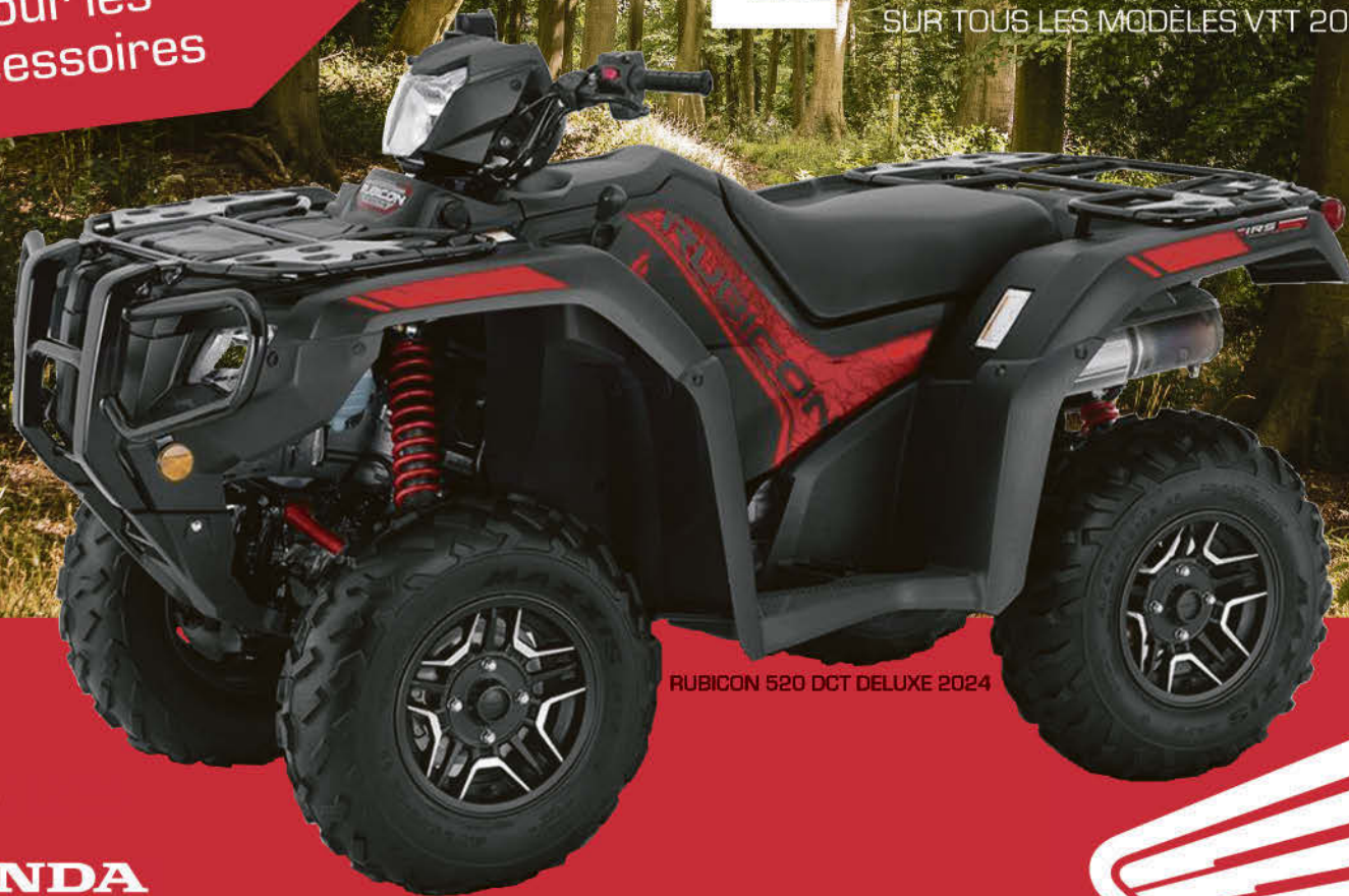
RUBICON 520 DCT DELUXE 2024

2,99%* 24 MOIS SUR TOUS LES MODÈLES VTT 2024