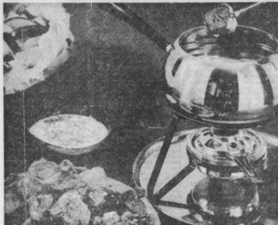
Pour l'hôte, pas de travail. Chaque convive fait cuire les bouchées d'agneau à son goût dans l'huile bouillante.

Laisser macérer plusieurs heures au réfrigérateur. Remuer occasionnellement. Au