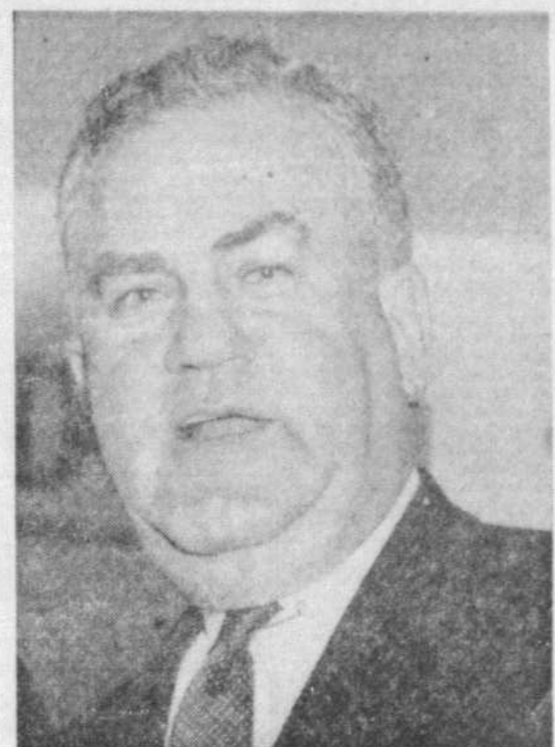
M. Maurice Bellemare, ministre de l'industrie et du commerce

commerce attribue cette tendance ascendante, malgré un certain ralentissement dans le domaine de la construction, au pourcentage élevé des investissements nets, soit 24 pour cent du produit national brut québécois en 1966. Le rapport fournit également des statistiques dans plusieurs domaines significatifs. Dans le domaine de l'emploi, il révèle que cent deux mille (102,000) nouveaux emplois ont été créés en 1966 en comparaison de quatre-vingt-cinq mille (85,000) en 1965. Malgré l'augmentation de 4.7 pour cent de la main-d'œuvre, la hausse accélérée du taux de volume de l'emploi a fait baisser le taux de chômage de 5.4 pour cent en 1965 à 4.7 pour cent en 1966. Quant au revenu disponible des Québécois, il a atteint, en 1966, $9,587 millions; ce qui représente un gain de 7.4 pour cent par rapport à 1965 qui est dû à une augmentation de 5.4 pour cent du volume de l'emploi de 5.4 pour cent et à un accroissement de 5.9 pour cent du gain horaire. Les investissements nets atteignent $3,566 millions, soit une augmentation de 10.4 pour cent en 1966. Le secteur de la fabrication, avec un taux de croissance de 24.4 pour cent, se classe premier. Le secteur