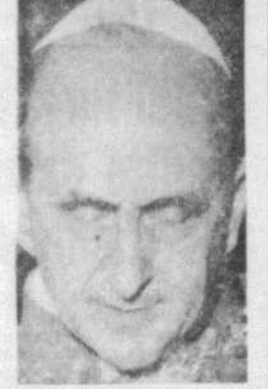
Texte intégral du message de Noël du pape à la page 5

dit le pape, qui seule possède le remède souverain aux insuffisances humaines". Rappelant aux hommes leur devoir de rendre gloire à Dieu, "source de toute existence et raison profonde de toute loi scientifique et morale", Paul VI met en garde l'humanité contre le péril de ce qu'il appelle "l'idolâtrie moderne".