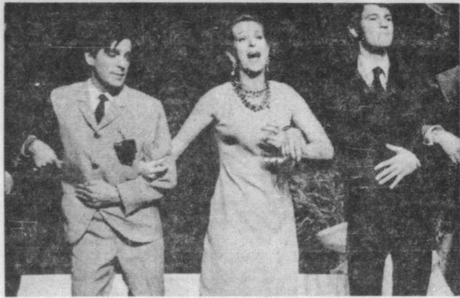
MARCEL DUBÉ ET "IL EST UNE SAISON"

Les plus grands succès étrangers ont été "Lawrence d'Arabie" de David Lean et "My Fair Lady" de George Cukor distribués en Inde avec beaucoup de retard.