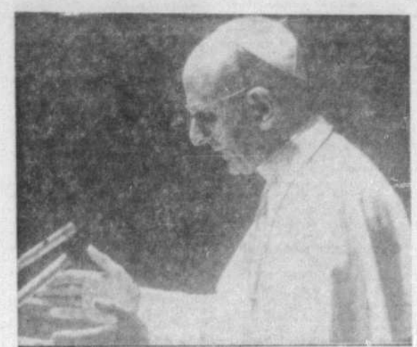
Le chœur de l'Armée Rouge.

Les grèves, engendrées de troubles sociaux, ne cessent de sévir au sein de la Belle Province. Le chômage, autre plaie