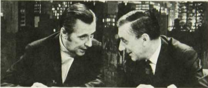
Moi et l'autre