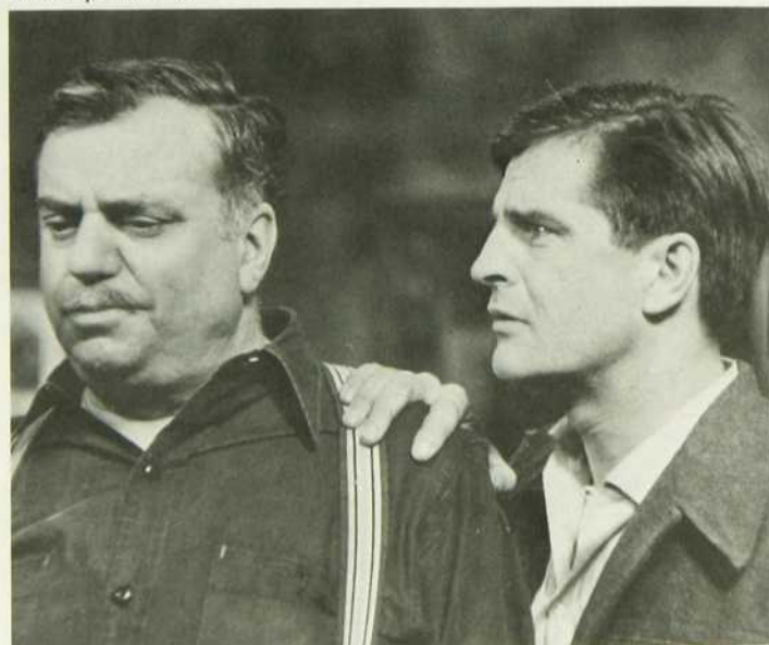
Les Trois Soeurs