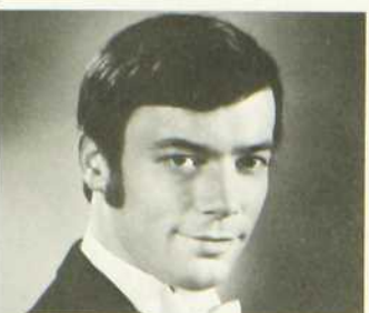
Les Grands Ballets canadiens