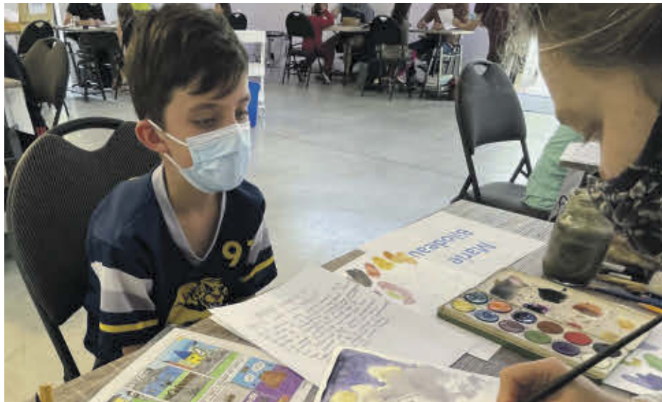
L'activité « À hauteur d'enfant », tenue le 25 septembre à Valcourt, a connu un grand succès. Un lancement aura lieu le 19 novembre, au Centre culturel Yvonne L. Bombardier.

« Nous avons dépassé notre objectif au niveau du nombre de participants et nous avons été agréablement surpris de voir que plusieurs personnes venaient de l'extérieur de la région de Valcourt. À auteur d'enfant aura offert une belle visibilité pour les organismes impliqués, c'est certain! Le côté valorisant d'une activité du genre, c'est de voir les sourires des petits... mais aussi ceux des plus grands! Les illustrateurs et les bénévoles ont possiblement eu autant de plaisir que les enfants durant la journée! », précise Kevin Bombar-