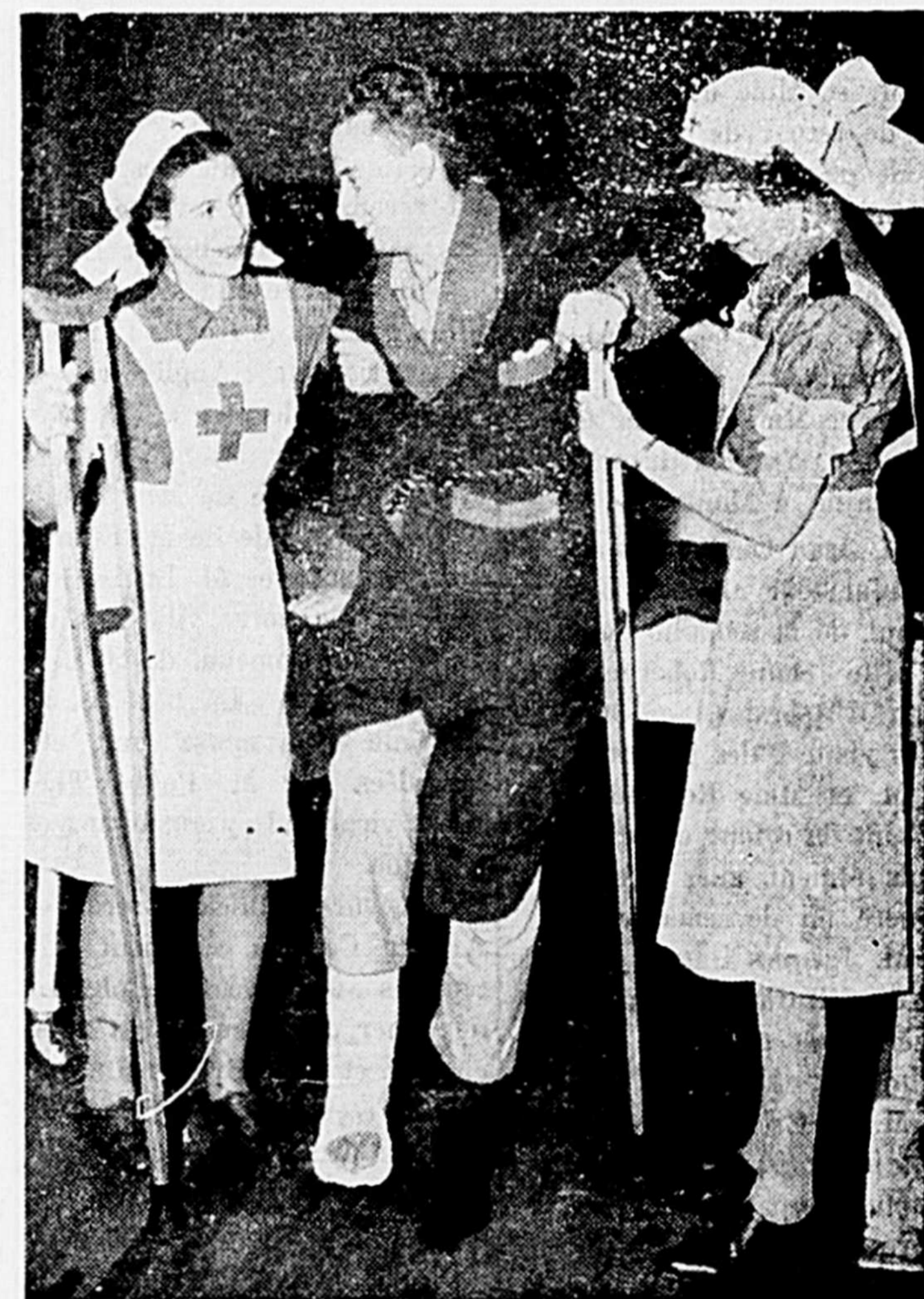
Un Canadien français blessé dans le terrible engagement de Dieppe, est hospitalisé à Ste-Anne-de-Bellevue. Des infirmières auxiliaires de la Croix-Rouge lui procurent non seulement les soins mais voient à son confort et à son réconfort.

La population du Québec était de 3,319,640 habitants en 1941, comparativement à 69,810 en 1765. En 1931, elle était de 2,874,255. Comme la population du Canada en 1941 était de 11,240,084 habitants, il résulte qu'en 1941 la province de Québec contenait près de 30 p. c. de toute la population canadienne.