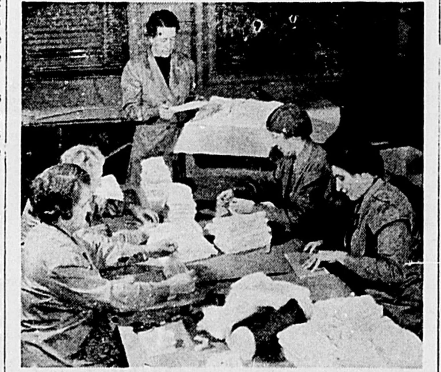
La préparation des pansements chirurgicaux exige beaucoup de soin et d'habileté. On voit ici les bénévoles occupées à ce travail à la Maison de la Croix-Rouge.