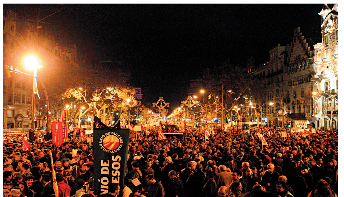
Manifestation anti-austérité à Barcelone le 14 novembre dernier