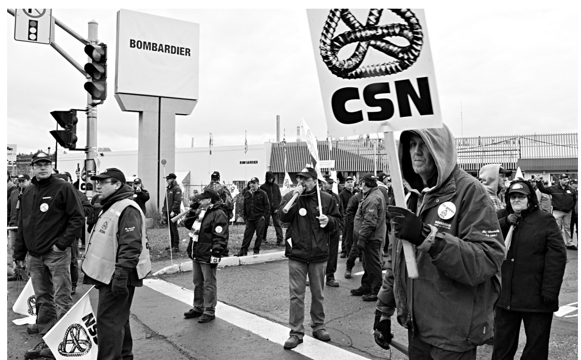
Les travailleurs en grève de Bombardier à La Pocatière ont rejeté la dernière offre de l'entreprise.