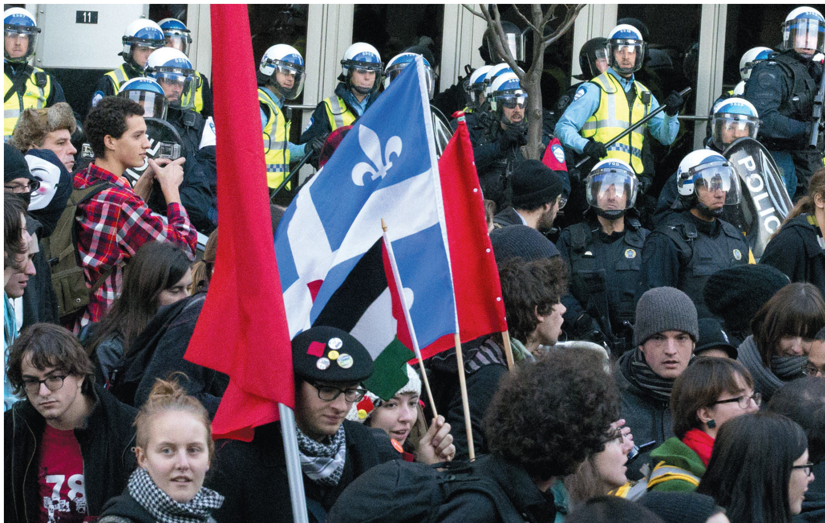
La manifestation s'est déroulée dans un calme relatif, en présence de quelques syndicats, de Québec solidaire et de policiers antiémeutes.