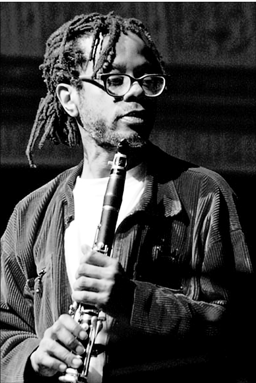
Don Byron n'a pas particulièrement l'intention de rendre hommage à Lester Young. Le clarinettiste new-yorkais s'en inspire malgré tout fortement.