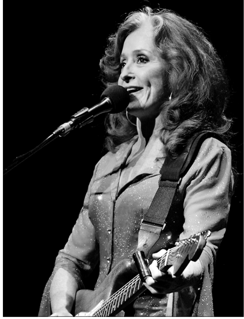
La salle Wilfrid-Pelletier était remplie à pleine capacité pour le passage de Bonnie Raitt à la Place des Arts.