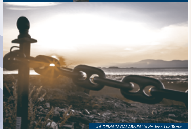
« À DEMAIN GALARNEAU » de Jean-Luc Tardif