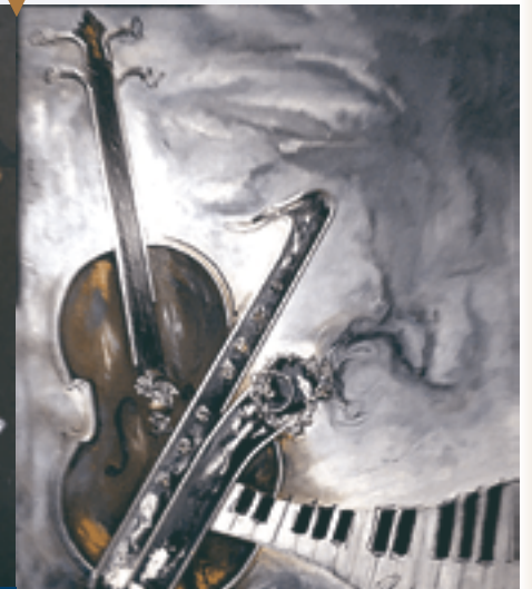
« EN AVANT LA MUSIQUE » de Richard Samson