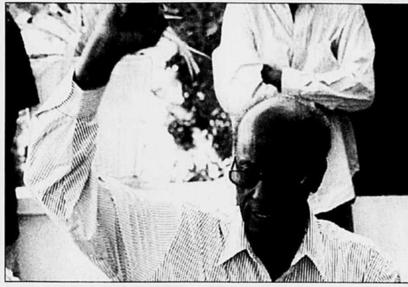
Le chef de guerre somalien Mohamed Farah Aïdid

Depuis samedi, les Nations unies ne font pratiquement aucune patrouille dans les rues pour assurer la sécurité, dans le but évident d'éviter de perdre des Casques bleus au cours