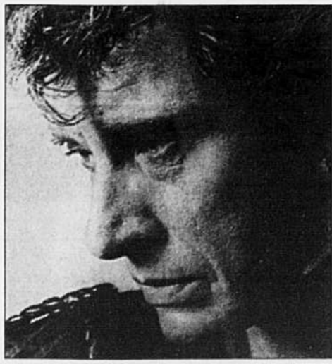
Johnny Hallyday, cet émule d'Elvis qui fête ses 50 ans aujourd'hui, traverse plutôt aisément les époques et le temps.

saye à diverses collaborations — plus ou moins réussies — comme en 1985 avec Michel Berger ( Rock and roll attitude , Tennessee , sa chanson préférée) qui lui ouvre les portes de l'autre public, en 1986 avec Jean-Jacques Goldman ( Gang ), ou encore en 1989 avec Etienne Roda-Gil ( Cadillac ) qui lui permettent de gagner en cohérence.