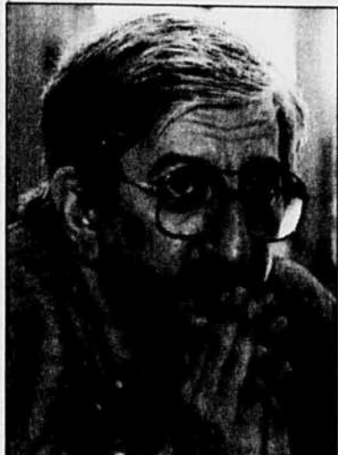
Le médiateur spécial de l'ONU Dante Caputo veut tirer parti de la nouvelle situation en Haïti.

Le médiateur spécial de l'ONU pour Haïti, l'Argentin Dante Caputo, invite tous les chefs de partis représentés au Parlement haïtien à se joindre à lui cette semaine à New York pour une nouvelle tentative de négociation. Pour essayer une fois de plus de sortir le pays de l'impasse politique dans laquelle il est enlisé.