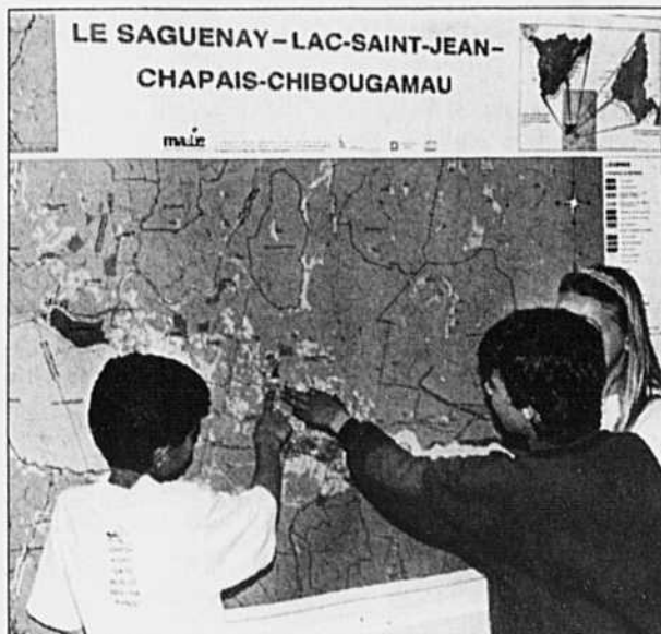
Une carte géographique géante a été produite dans le cadre du projet MADIE, un projet à vocation environnementale qui a l'originalité de renseigner les étudiants sur la géographie physique et humaine de la région dans laquelle ils vivent.

Écologie en action en Sagamie, un organisme à but non-lucratif qui existe depuis 1983, a reçu, en termes de ressources humaines et financières, l'appui des milieux scolaire, gouvernemental et des affaires. Fort de cet appui massif du milieu et disposant d'un budget de 430 000$, étalé sur deux ans, on a commencé en janvier 1992 la production du matériel didactique. Au point de départ, une enquête, financée par l'UNESCO, est menée auprès des enseignants de la région afin de connaître leur opinion,