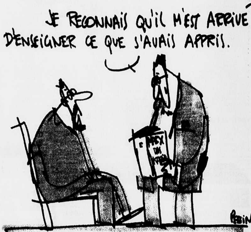
Cent trente professeurs accusés de collaboration ont déjà dû quitter leur poste.

Faut-il oublier le passé ou bien réclamer des comptes aux responsables de l'ancien régime? A travers les questions qu'elle soulève, l'Université Humboldt