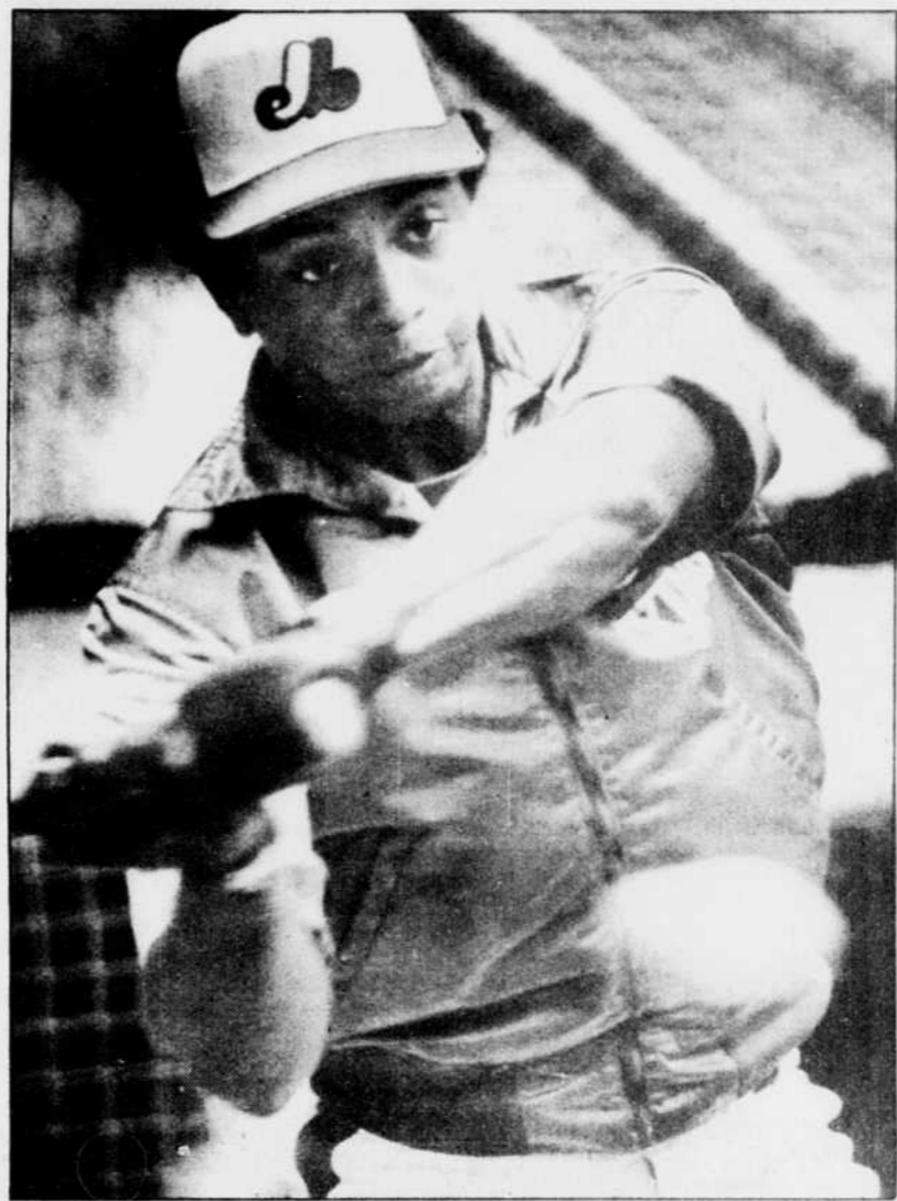
A son retour dans l'alignement des Expos, Hubie Brooks a réussi un coup sûr en cinq apparitions au bâton.