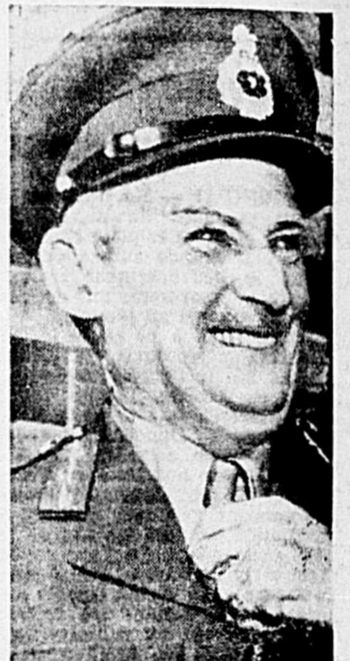
Ce large sourire du Feld-Marchal Vicomte Montgomery, de l'Armée, préface de bonnes nouvelles. Il est photographié ici alors qu'il venait de rendre visite au président Eisenhower à l'hôpital militaire Fitzsimons...