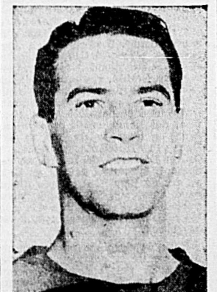
Olmstead compte pour Canadien

Les Canadiens, qui ont 19 points, ont toutefois joué deux parties de plus.