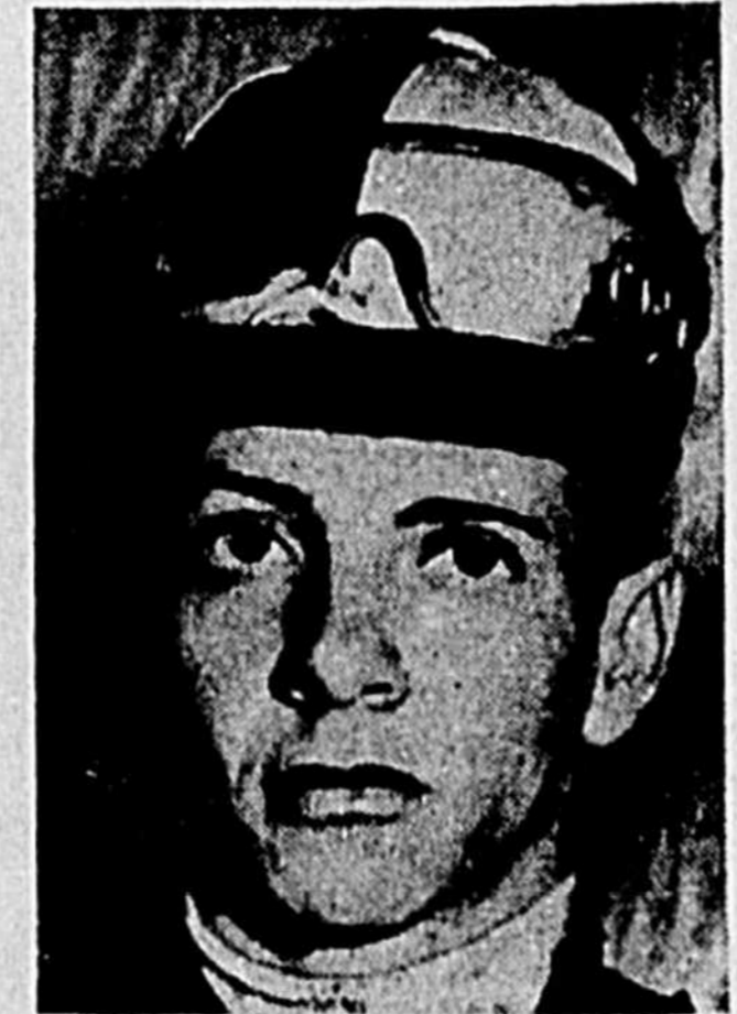
400 VICTOIRES? — Après avoir conduit quatre gagnants à la piste de Laurel, Willie Shoemaker, meilleur jockey des États-Unis pour l'année, ambitionne maintenant de devenir le deuxième jockey à réunir 400 victoires en une seule année. Il a déjà conduit 372 montures en première place. Le record mondial de 485 victoires est détenu par Willie Shoemaker.