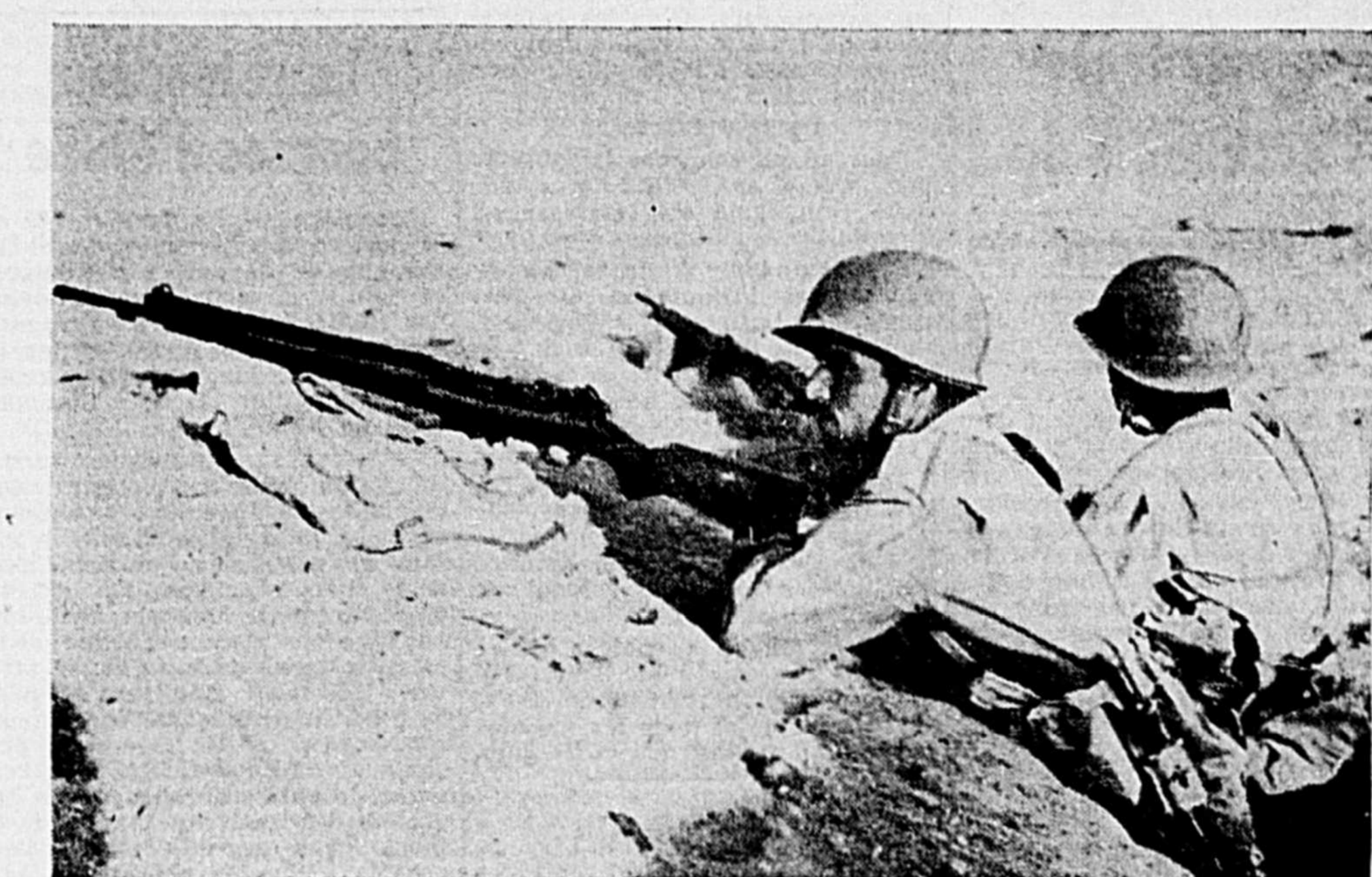
CES SOLDATS TAPIS DANS L'OMBRE d'une tranchée traissent l'esprit d'inquiétude qui plane au-dessus de la frontière israélo-égyptienne. Chaque état se concentre sur El Sabha, un poste avancé de cette zone dont chaque état réclame la possession.