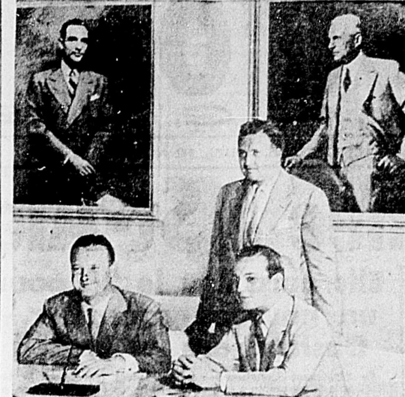
Sous un minutuel contrôle, 60 pour cent du monopole de la compagnie Ford, va à la famille Ford demeurée la plus importante dans l'administration de la compagnie. Le reste de 40 pour cent ira pour l'administration et la vente. Cette photo nous fait voir un photographe de Henry Ford, le fondateur de la Compagnie et Edsel son fils, père du président actuel de la Ford Compagnie. De gauche à droite nous remarquons, Benson Ford, vice-président, Henry Ford 2, président et William Clay Ford

Cette photo nous montre les trois ministres des puissances de l'ouest en train de prendre une tasse de café alors que M. Pinay, ministre de la France offrait le déjeuner aux délégués de la conférence de Genève. Ils discutent des problèmes de l'Allemagne, gauche à droite, ce sont, Harold McMillan, Antoine Pinay et M. Dulles