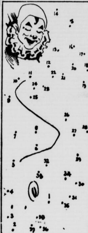
Tracez de 1 jusqu'à la fin des nombres; puis colorez.

billets et vous bénéficierez en plus d'une intéressante réduction. Les ventes de billets se font au Dominion Square Building.