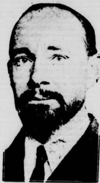
SIR HUBERT WILKINS , célèbre explorateur australien projette une expédition scientifique sur le continent antarctique d'une superficie de 3,000,000 de milles carrés.

assiégé sa demeure bien qu'une pancarte dise qu'il n'est pas chez lui. "Laissez-nous jeter rien qu'un regard, supplient-ils, nous sommes venus de si loin".