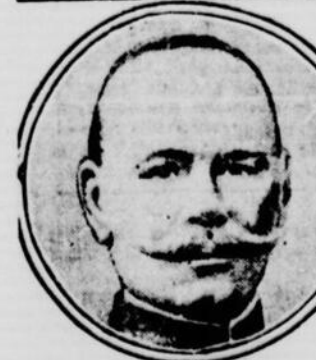
La somme de $1,500,000 déposée à la Banque Morgan à Paris par feu l'amiral russe Alexieff (ci-dessus), fut payée par erreur à un nommé Siméon Khasine qui réussit à obtenir cette somme par fraude. La police le recherche quelque part au Vénézuéla.