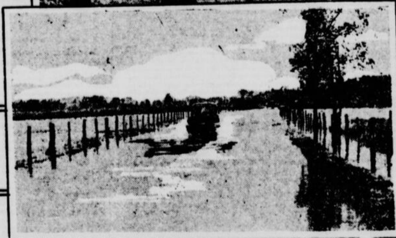
Les averses torrentielles qui ont inondé Québec et les environs, ont causé des dégâts considérables, le déraillement d'un train et immobilisé des milliers de voyageurs le long de la route nationale et des routes connexes. Dans la photo (1) l'aspect que présentait dans la matinée un magasin situé à l'intersection des rues Sheppard et Saint-Louis, dans Sillery; (2) les routes inondées alors que des camionneurs remorquaient des automobiles de touristes avec leurs puissantes voitures. (3) Le pont de Cap-Rouge sectionné par la crue des eaux de la rivière du même nom et dont l'effondrement a causé l'isolement de ce centre de villégiatures. (4) Aspect du village de Saint-Augustin inondé, (5) Chalets inondés à Champigny. (6) Les cantonniers maintenant au travail réparent une large trouée pratiquée par les eaux en plein centre de la route. (7) Une automobile se fraye lentement un chemin au pied de la Suête où la route nationale disparaît sous plusieurs pieds d'eau.