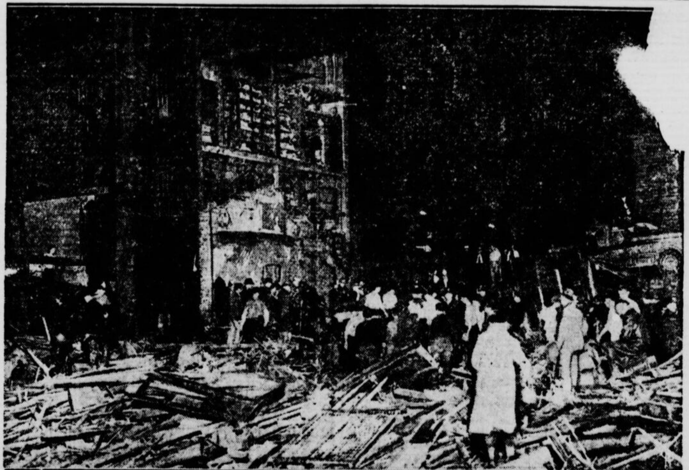
Voici ce qui reste d'une ancienne maison située dans une impasse de New Brighton, Staten Island, qui, en s'écroulant, causa la mort de plusieurs personnes. On voit ici les sauveteurs, fouillant pour trouver les corps des victimes. L'habitation, une ancienne manufacture transformée en local résidentiel, s'affaissa à la suite d'une inondation dont les eaux torrentielles minèrent les fondations.