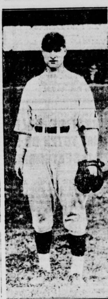
LLOYD WANER a dirigé l'attaque des Pirates contre Cubs, cognant cinq coups sûrs consécutifs.