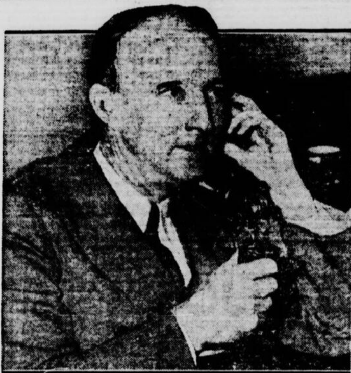
Le président Roosevelt a annoncé au Sénat la nomination du sénateur HUGO-L. BLACK, démocrate pour l'Alabama, (ci-dessus), en remplaçant du juge Willis Van Devanter, de la Cour Suprême.