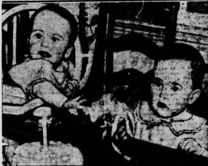
Ces deux bambines, orphelines à l'âge d'un mois, ont maintenant une vingtaine de mamans, des étudiantes à l'université Cornell, Ithaca, Etat de New-York, faculté de l'enseignement ménager.