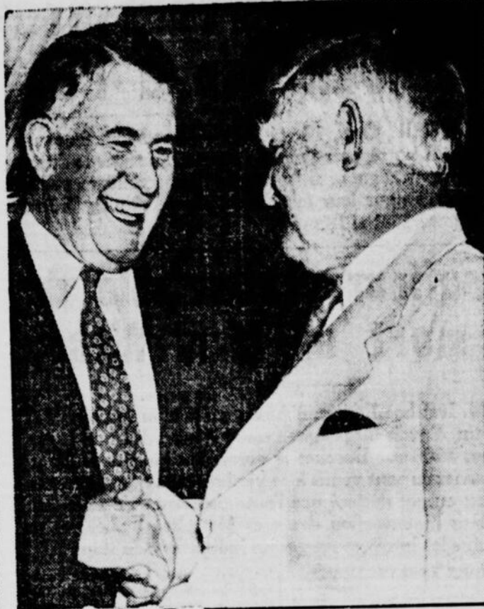
Le sénateur ALBEN BARKLEY, du Kentucky (à gauche) souhaite la bienvenue au vice-président JOHN-N. GARNER, à son arrivée à Washington, après que celui-ci eut été élu à la direction du Sénat. Garner représente le président Roosevelt qui n'a pu assister au banquet donné à la suite de ces élections.

Installées dans de petites nacelles suspendues à 15 miles au-des-