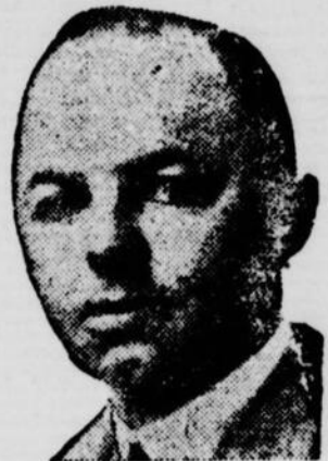
L'hon. Mitchell HEPBURN