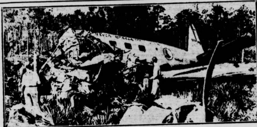
Voici tout ce qui reste d'un avion de l'Eastern Airline, qui s'est abattu le 10 août dans un buisson épais près de l'aéroport Sholtz récemment inauguré à Daytona Beach où il s'était élevé à l'aube. Quatre personnes furent tuées et cinq autres furent blessées. Le gérant de l'aéroport déclara qu'il n'avait pas été mis au courant de l'érection d'une nouvelle ligne de transmission, et il est convaincu que le pilote de l'avion ne le savait pas non plus.