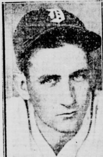
CHARLEY GEHRINGER des Tigers a cogné un coup de circuit et deux doubles pour produire six points contre les White Sox.

Les Yankees et les Red Sox ont divisé un programme double dans