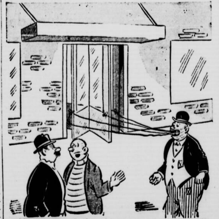
"Il veut se faire extraire toutes les dents en une seule séance".