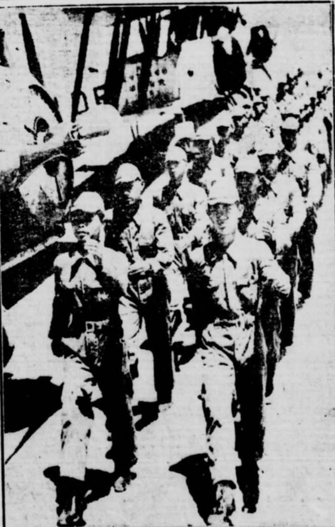
Bien que la guerre sino-japonaise ne soit pas officiellement déclarée, la situation dans la Chine du Nord ne laisse pas d'être très tendue. Aussi, le Japon se prépare-t-il en conséquence. Il fait actuellement porter son effort à l'entraînement de jeunes Nippons comme aviateurs, marins et mécaniciens. On voit un groupe de jeunes Japonais à l'entraînement aérien. Ils deviendront ensuite pilotes.