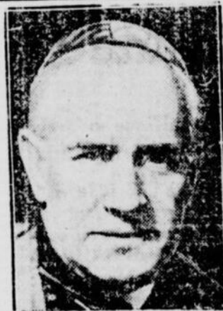
Le cardinal PATRICK HAYES, de New-York, est à l'hôpital souffrant d'une indigestion. Il sera en mesure de quitter l'hôpital dans quelques jours, annonce-t-on.