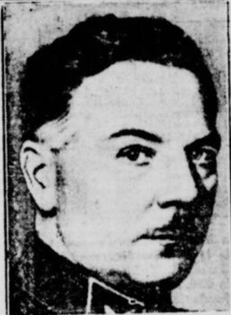
Le commissaire de la guerre de la Russie, M. VOROSHILOV, a été blessé d'une balle de revolver par un officier, à la gare de Toula. Le ministre fut transporté en avion à Moscou où l'on a extrait la balle.