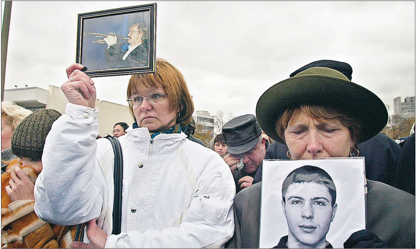
Des femmes exhibaient des portraits de leurs proches, hier, à Moscou, devant un monument récemment dévoilé à la mémoire de ceux qui ont perdu la vie, il y a un an, lors d'une attaque des rebelles tchétchènes dans le théâtre de la Doubrovka. Parmi les 800 otages, 129 sont morts sur le coup ou dans les jours qui ont suivi la crise.