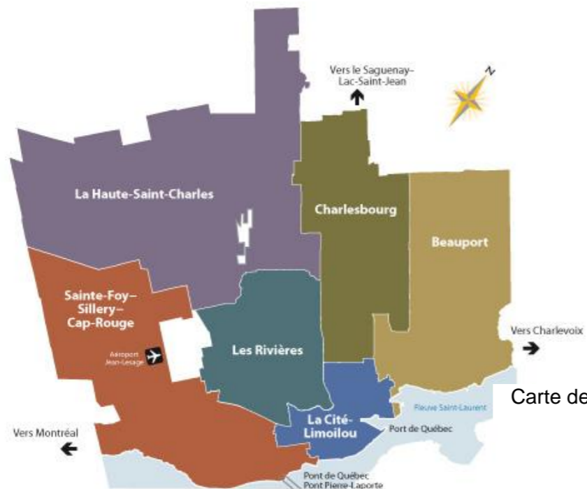
Carte de la Ville de Québec par arrondissements

À la suite des fusions municipales du début des années