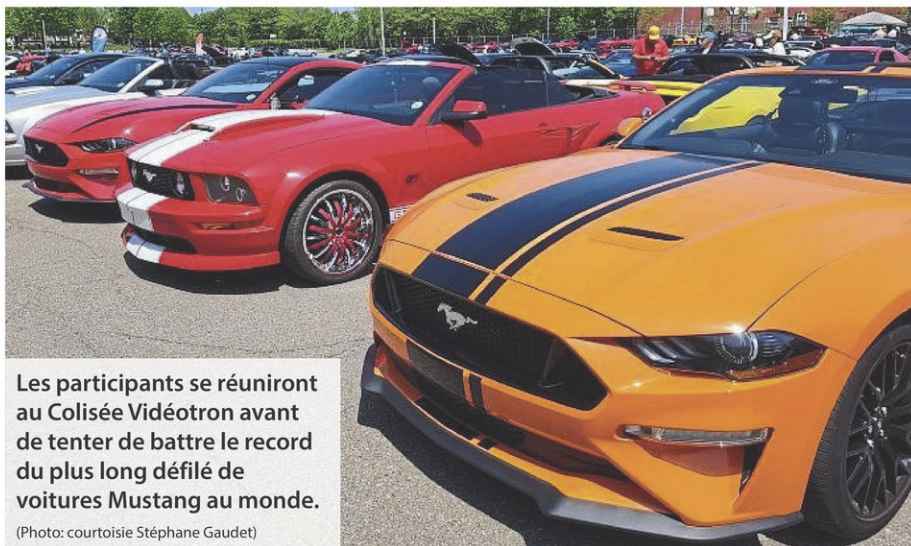
Les participants se réuniront au Colisée Vidéotron avant de tenter de battre le record du plus long défilé de voitures Mustang au monde.

«On ne veut pas être une nuisance sur les routes, c'est pour ça qu'on fait ça tôt. C'est mieux pour qu'on n'ait pas trop de trafic, déjà que j'ai l'impression qu'il va y avoir beaucoup de curieux qui vont vouloir venir voir ça. Trois-Rivières – Québec, en temps ordinaire, on fait ça en une heure et demie, mais quand on est en parade, c'est beaucoup plus long. Ça peut nous prendre jusqu'à une heure de plus.»