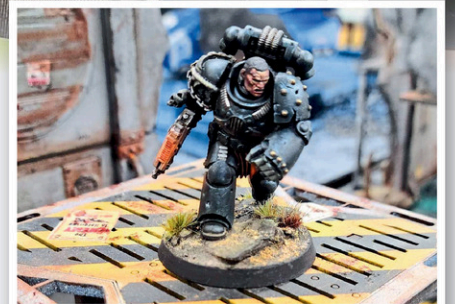
L'événement regroupe une douzaine de jeux de figurines provenant de différents univers, tels le médiéval, le futuriste, Marvel, Star Wars et le Seigneur des anneaux, notamment.

« On ne se met jamais d'objectif de visiteurs. Notre but, c'est de faire connaître le hobby, de montrer ce que sont nos événements et de les