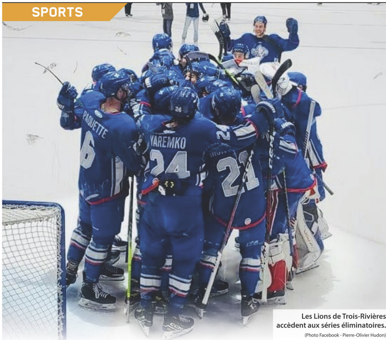
Les Lions de Trois-Rivières accèdent aux séries éliminatoires.