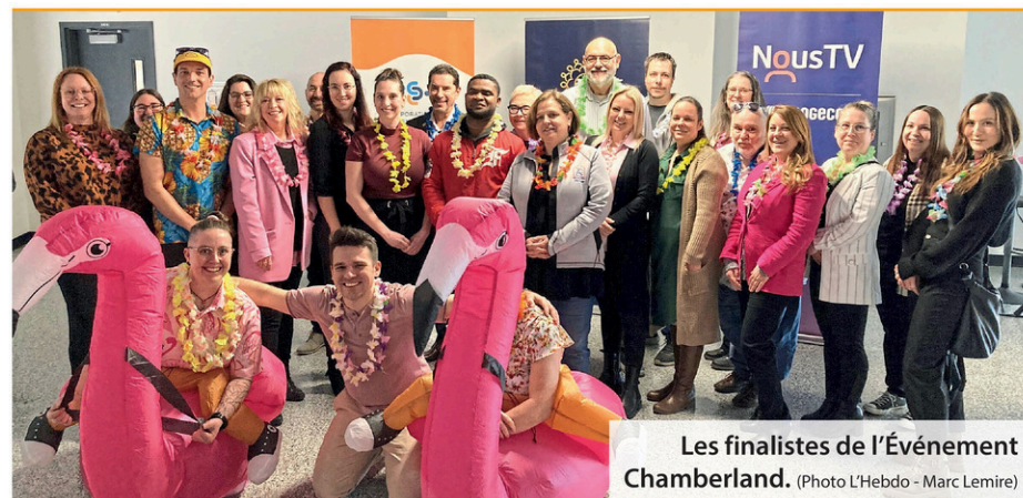
Les finalistes de l'Événement Chamberland.

Vous êtes un organisme à but non lucratif et vous souhaitez faire paraître une annonce dans l'agenda communautaire? Écrivez-nous à redaction@lhebdojournal.com