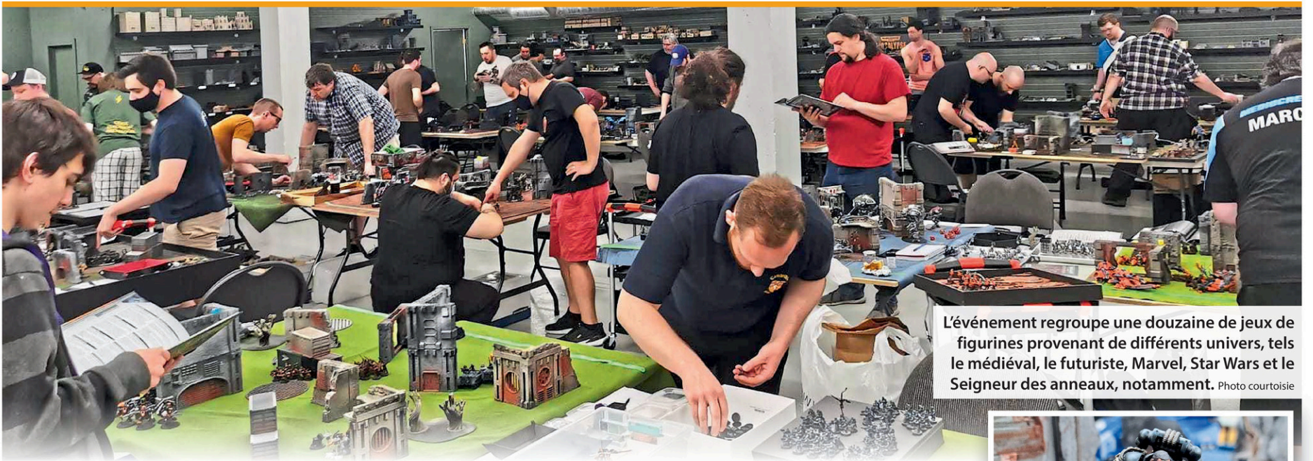
L'événement regroupe une douzaine de jeux de figurines provenant de différents univers, tels le médiéval, le futuriste, Marvel, Star Wars et le Seigneur des anneaux, notamment.