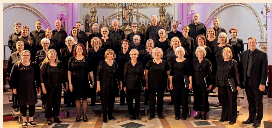
Le Choeur du Roy célèbre ses 20 ans d'existence.

Des billets seront également disponibles à la porte le jour du concert au coût de 25 $.