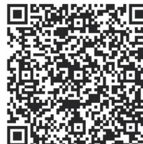
Consultation sur les plans d'aménagement forestier opérationnels Unités d'aménagement visées 026-51, 041-51, 042-51, 043-51, 043-52

Vous avez jusqu'au 17 mai 2024 à 23 h 59 pour transmettre vos commentaires.