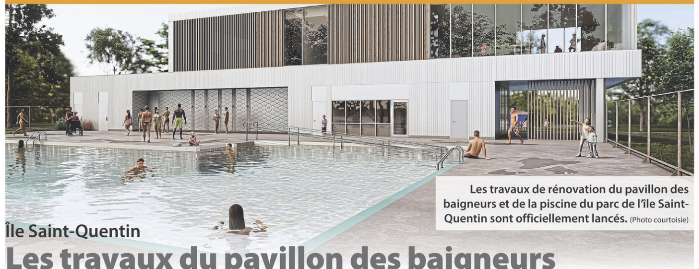
Les travaux de rénovation du pavillon des baigneurs et de la piscine du parc de l'île Saint-Quentin sont officiellement lancés.

Les personnes intéressées à mettre leur tête à prix pour la cause peuvent déjà s'inscrire au www.tetesrasees.com . (M.E.B.A.)