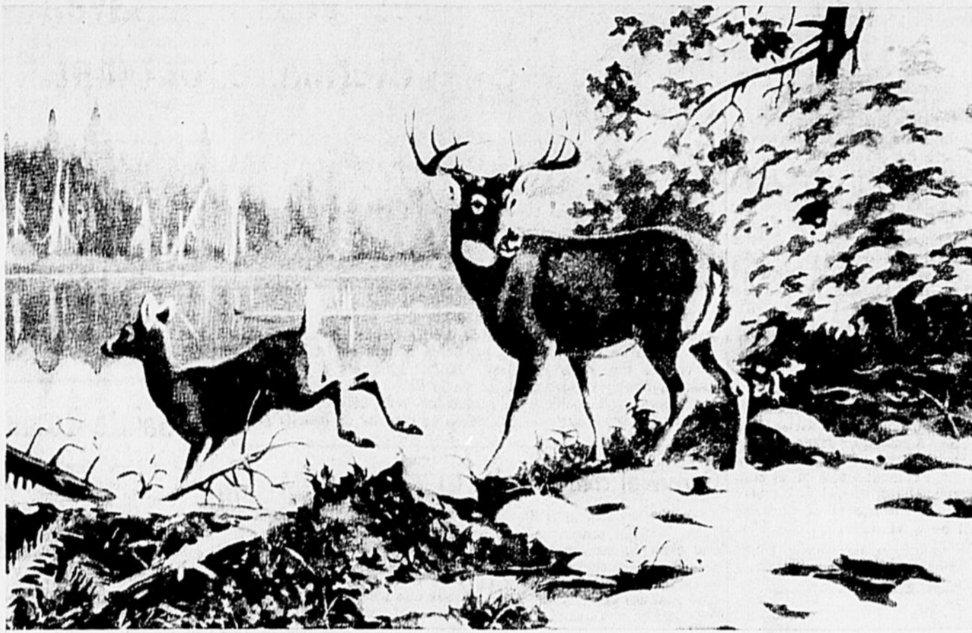
Le cerf de Virginie ou chevreuil est le gibier le plus recherché au Canada. Un mâle fournit une soixantaine de livres de venaison.

1-Casavant: Dupré, Fortin, 2:27 2-Patro: Caron (Comtois) 5:24 (Suite en page 5)