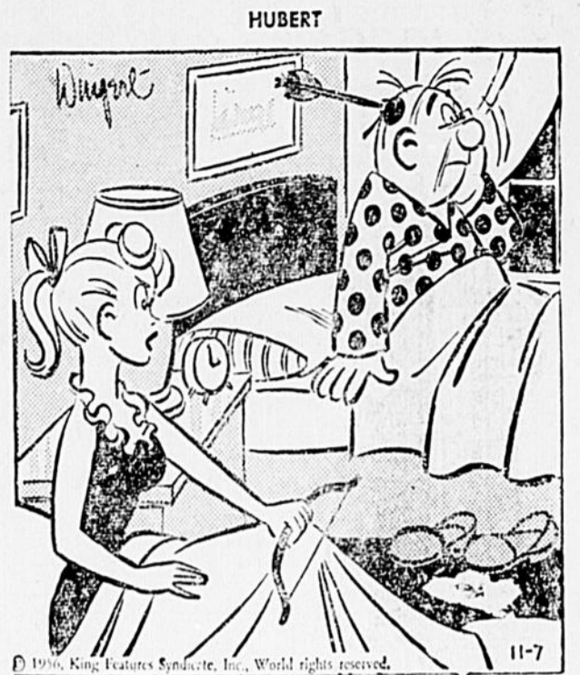
"C'est ta faute... Tu ronçais encore!"