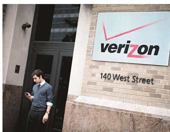
La société américaine Verizon aurait également fait une offre sur Wind mobile.