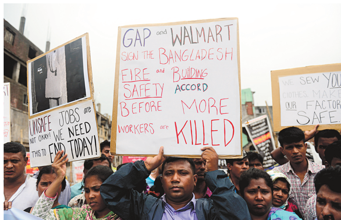
Les Bangladais avaient manifesté vigoureusement leur désir de voir les entreprises américaines signer un accord de responsabilité pour la sécurité des travailleurs.