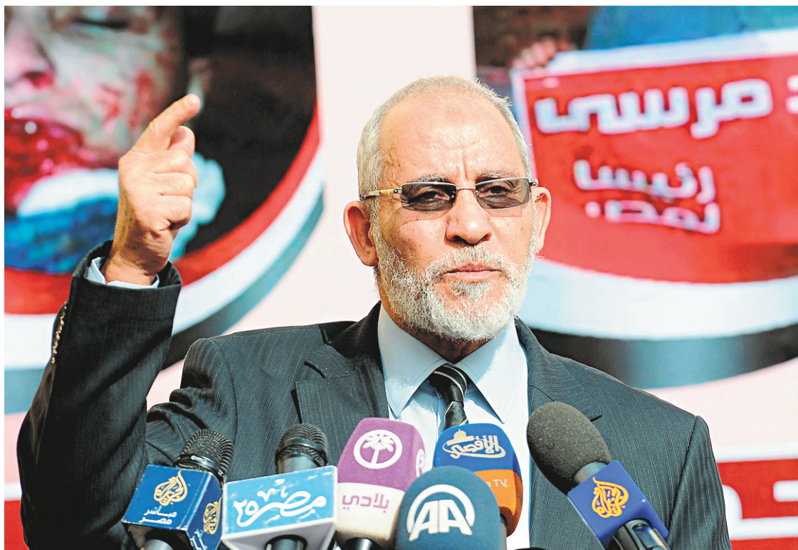
Le guide suprême, Mohammed Badie, lors d'une conférence de presse l'an dernier