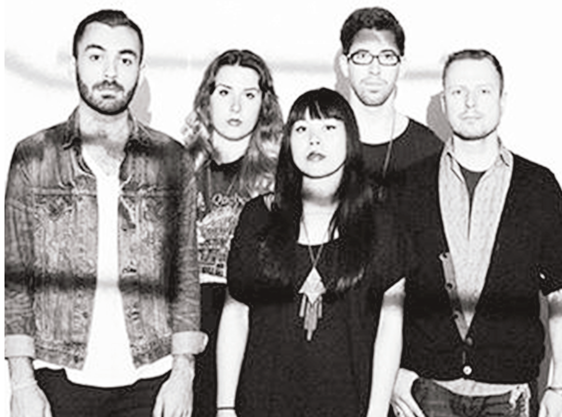
Les cinq musiciens de The Belle Game ont livré il y a quelques mois un premier disque, Ritual Tradition Habit , fait d'une pop assez chargée, intérieure, claire obscure.