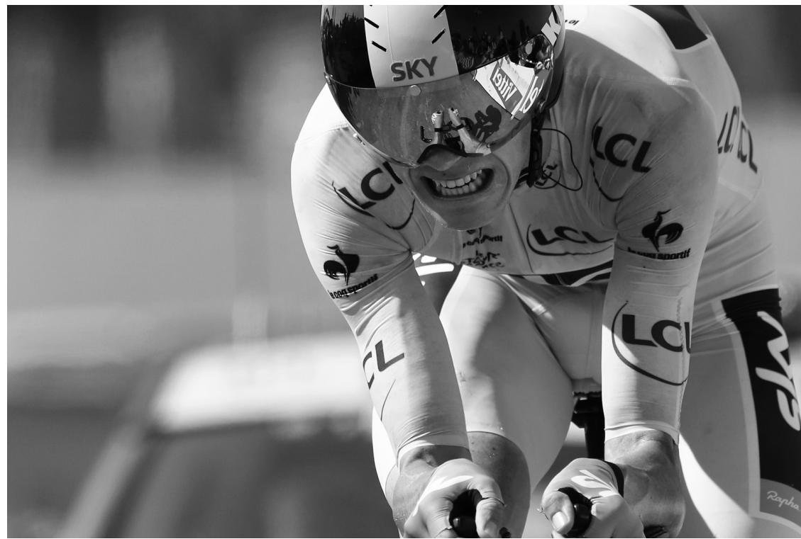
Le leader de la Sky, Chris Froome, médaillé de bronze à Londres au contre-la-montre, a creusé l'écart avec ses poursuivants au classement général.

Mais malgré ces nouvelles dispositions, le plus proche poursuivant pour la position de tête, l'Espagnol Alejandro Valverde (Movistar), a pris 2 minutes de plus que Froome pour terminer le parcours, se plaçant à 3 min 25 derrière le meneur au classement général. Les autres suivent, sans grand changement dans les écarts. Sauf peut-être pour le Polonais Michał Kwiatkowski (Omega Pharma-Quick Step), désormais septième au général, qui a enfilé le maillot blanc du meilleur jeune avec une per-