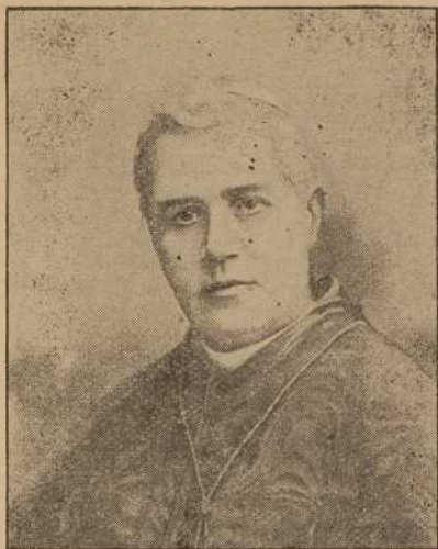
SA SAINTETÉ PIE X.

S. S. Pie X (JOSEPH SARTO), (264 e successeur de saint Pierre) né à Riese, diocèse de Trévise, (Italie), le 2 juin 1835 ; ordonné prêtre en l'église de Castel-Franco, le 18 septembre 1858 ; appelé à la cure de Tobomlo en 1867, et peu de temps après à celle de Salzano ; nommé chanoine de la cathédrale de Trévise en 1875 ; préconisé évêque de Mantoue le 10 novembre 1884 et sacré à Rome, par le cardinal Parocchi ; créé cardinal du titre de Saint-Bernard aux Thermes , le 12 juin 1893 et promu au patriarcat de Venise par Léon XIII, le 45 du même mois ; élu souverain pontife le 4 août 1903 et couronné le dimanche, 9 août 1903.