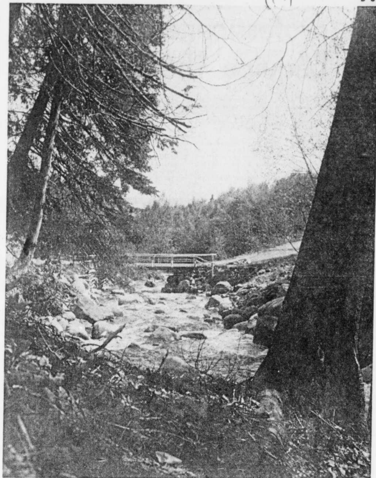
Près de Saint-Joseph-de-la-Rive, la rivière Les Eboulements.