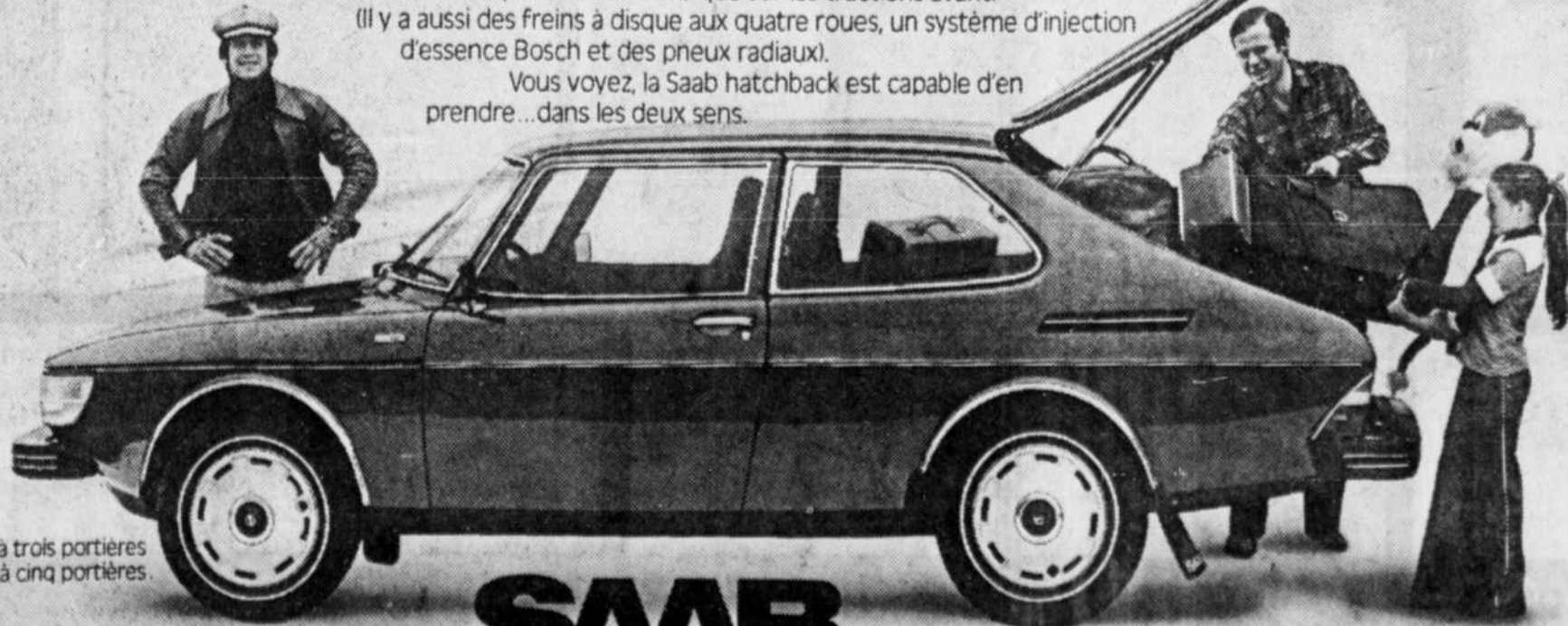
Saab hatchback à trois portières et à cinq portières.

Vous voyez, la Saab hatchback est capable d'en prendre... dans les deux sens.