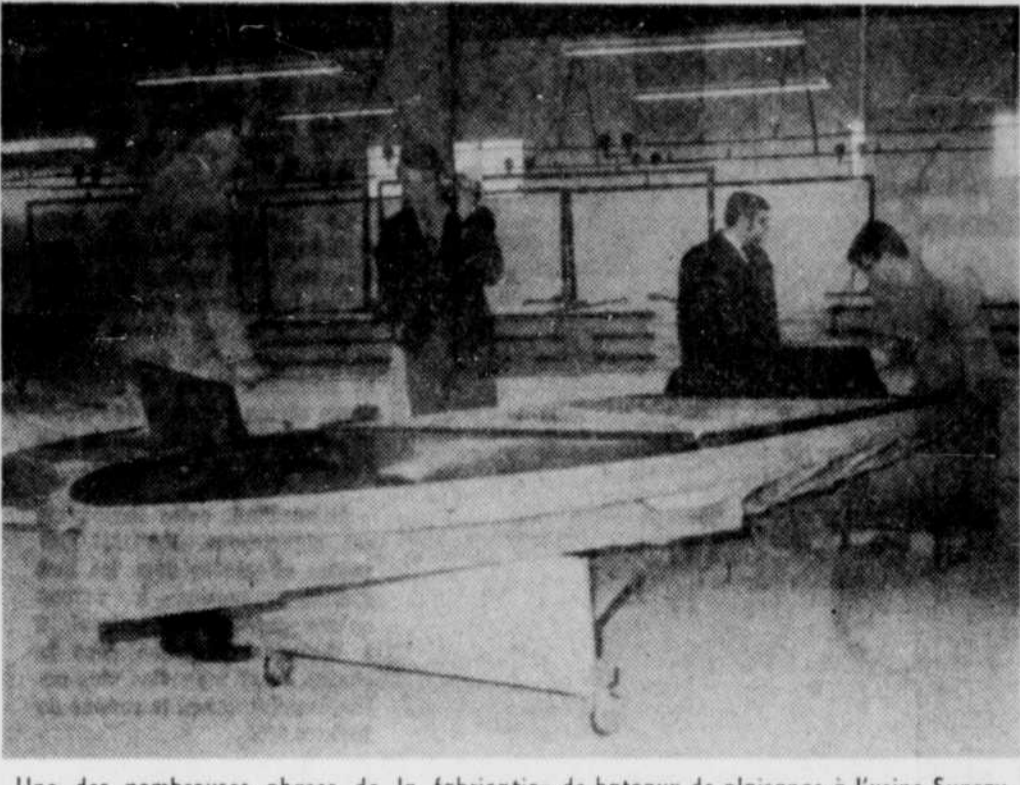
Une des nombreuses phases de la fabrication de bateaux de plaisance à l'usine Sunray de Victoriaville.

VICTORIAVILLE, (JD) — Le parc industriel de la ville de Victoriaville a connu un essor fulgurant au cours de 1969. Et tout porte à croire qu'il est promis à un développement tout aussi remarquable en 1970.