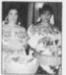
Lorsqu'il s'agit d'un voyage de groupe, l'accueil est souvent impressionnant dans les meilleurs hôtels.

Huatulco vient tout juste de prendre son envol. Il y a une douzaine d'années, il n'existait là qu'une toute petite communauté de pêcheurs qui n'avaient ni électricité, ni téléphone, ni même de routes carrossables. Alors survint le Club Med... et le progrès. Mais cette fois, le gouvernement mexicain décida que le progrès devrait être