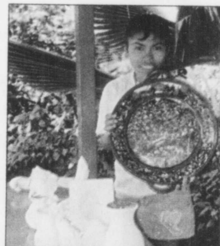
Un peu partout, dans les rues, sur les plages et même dans la cour intérieure des grands hôtels, vous serez sollicité pour acheter un souvenir qu'il faut nécessairement marchander, conformément aux coutumes du pays.