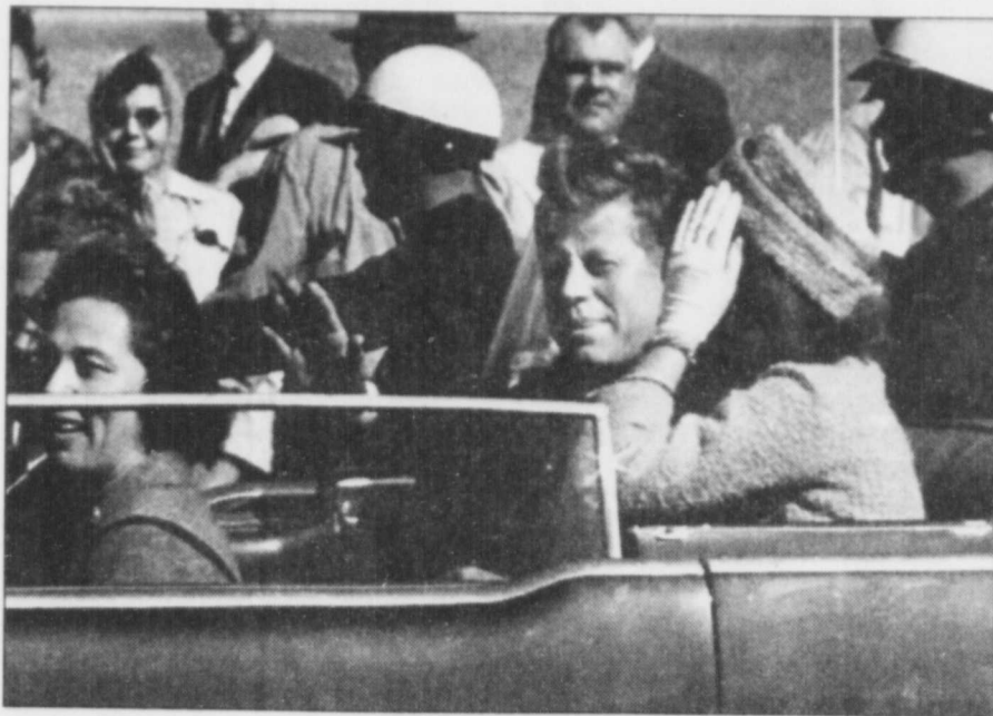
Une minute avant son arrivée au coin des rues Elm et Houston, le 22 novembre John F. Kennedy salue la foule.

sinat. Il fut tourné par Abraham Zapruder, un tailleur de Dallas, au moment où la limousine passait devant lui. Il montre Kennedy portant la main à la gorge lorsque la balle l'a atteint dans le dos. Le musée ne présente pas la suite du film.