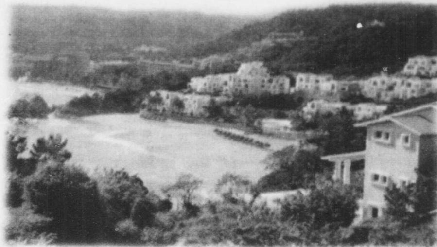
Huatulco ce n'est pas une ville, c'est une destination qui compte neuf baies spectaculaires et une vingtaine de plages plus ou moins sauvages. Un parc écologique de 35 kilomètres de longueur.

S'il est un hôtel où vous devez séjourner lors de votre visite à Manzanillo, c'est le Karmina Palace, dont l'architecture, résolument aztèque est à faire rêver. Un 18 e trou, invisible sur cette photographie, a même été aménagé, sur une île artificielle, juste devant l'hôtel.