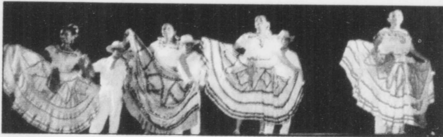
Les spectacles folkloriques sont toujours très populaires et surtout très colorés, chaque État s'identifiant par un costume et une danse qui ne manquent pas d'originalité.

Manzanillo, c'est Acapulco il y a 40 ans et Huatulco... c'est l'avenir.