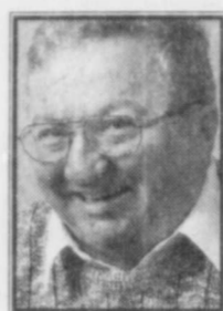
Pierre Champagne @lesoleil.com

La construction d'hôtels de luxe est en plein essor en Floride, rapportait cette semaine Le Soleil de la Floride. Exception faite du légendaire Breakers de Palm Beach et du Hilton Fontainebleau de Miami Beach, les hôtels de quatre ou cinq étoiles étaient rares, les chaînes hôtelières ayant préféré construire des établissements à prix modeste. Il ne s'était pas construit un hôtel de grand luxe dans la région depuis 30 ans, jusqu'à ce qu'on inaugure le Loew's de Miami Beach, l'an dernier. Maintenant, c'est la ruée. Mandarin Oriental construit un hôtel de 329 chambres sur Brickell Key. Ritz Carlton vient de s'approprier le vieil hôtel Di Lido, sur la Collins, pour en faire un palace cinq étoiles. Ritz Carlton s'installe aussi à Coconut Grove, dans les 14 premiers étages d'une des tours jumelles de 20 étages. Marriott construit un hôtel de luxe de 300 chambres au 1111, Brickell, à Miami. Ouverture prévue au printemps. Four Seasons a l'intention d'ériger un hôtel de 286 chambres de luxe, dans le complexe Millennium Towers, toujours sur Brickell Avenue. Le Diplomat, à Hollywood, comptera plus de 1000 chambres, ce qui en fera le deuxième plus grand hôtel du sud de la Floride, après le Hilton de Miami. Enfin, le Shore Club Hotel, sur l'avenue Collins, à Miami Beach, deviendra lui aussi un hôtel cinq étoiles une fois que les travaux de rénovation, qui viennent de débuter, seront complétés.