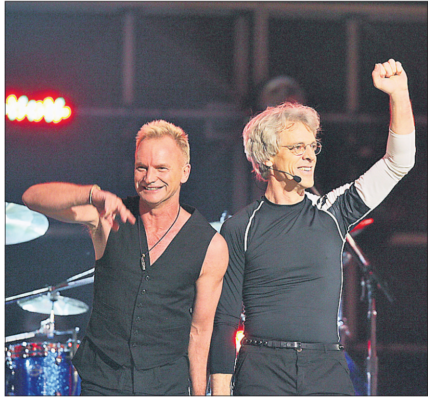
Plus de 20 ans après s'être séparés, les musiciens du groupe pop-rock The Police, dont Sting et Stewart Copeland, sont remontés sur scène hier soir à Los Angeles, lors du numéro d'ouverture de la remise des prix Grammy.