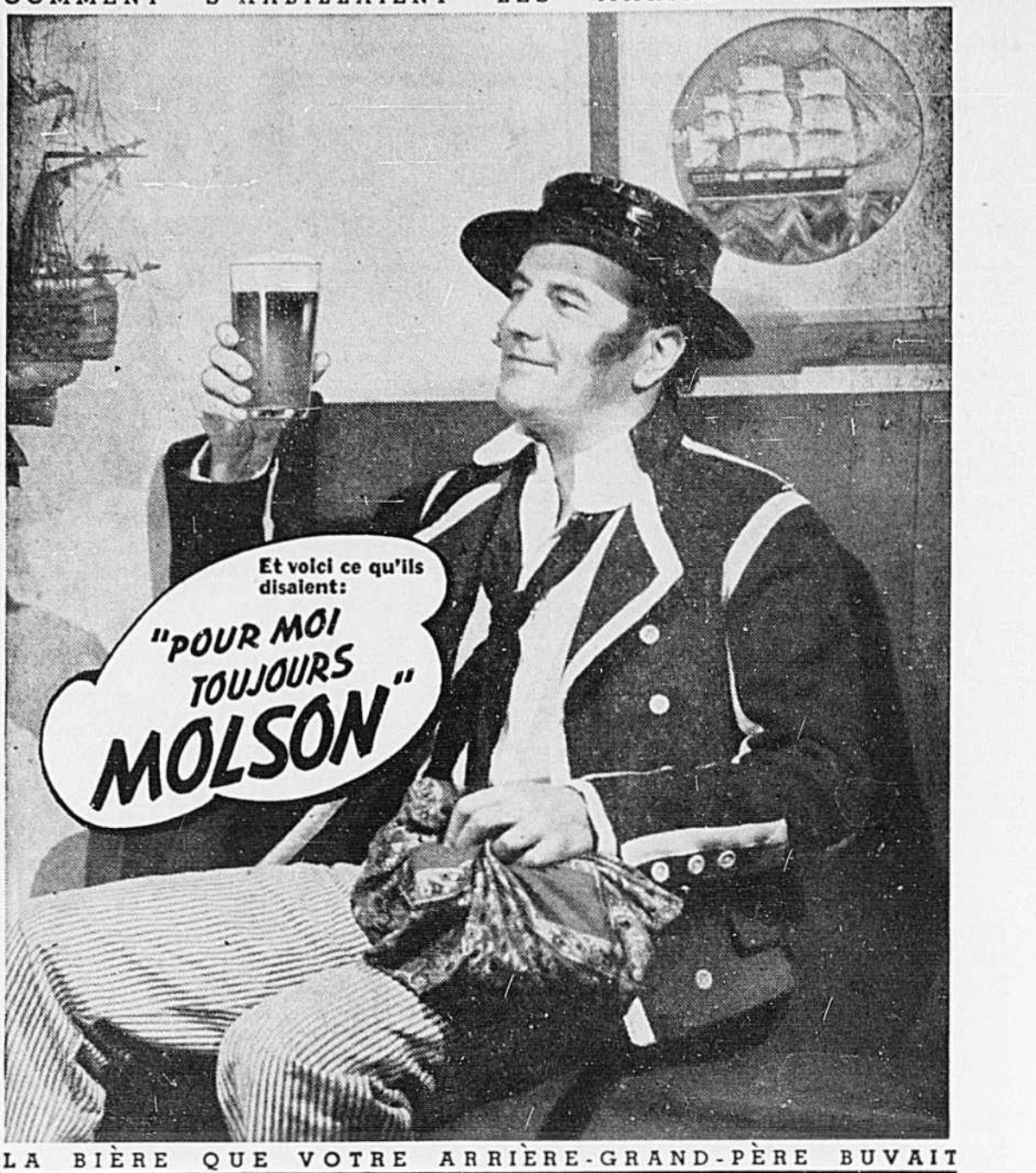
LA BIÈRE QUE VOTRE ARRIÈRE-GRAND-PÈRE BUVAIT