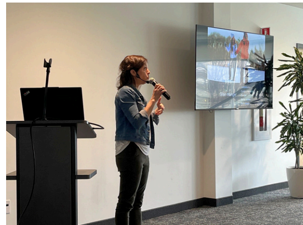
Sylvie Bernier, médaillée d'or et conférencière