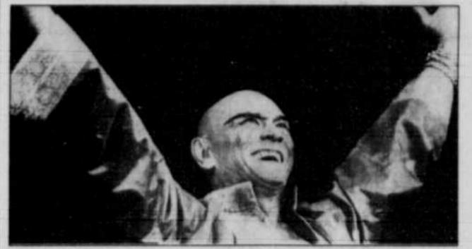
Le comédien Yul Brynner, lors de la dernière du « Roi et moi ».