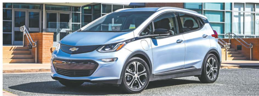
La Bolt EV