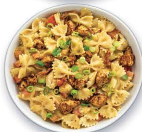
PÂTES AU POULET CAJUN 995 g