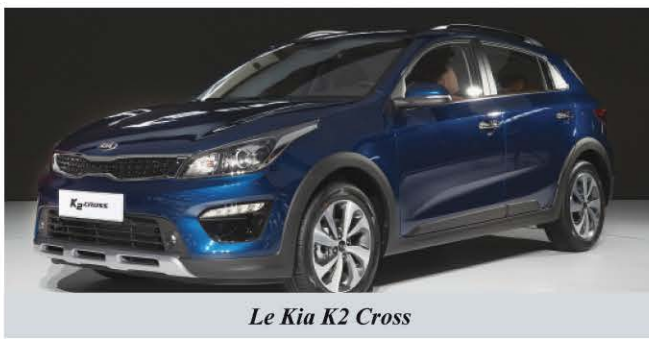
Le Kia K2 Cross

Toujours dans le monde des utilitaires, Kia dévoile en 2019 un gros modèle basé sur le