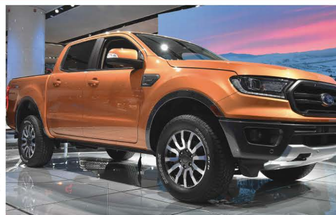
Le Ford Ranger

Ce ne sont pas les nouveaux modèles qui ont fait la manchette chez Ford cette année, mais plutôt la décision de retirer du marché pratiquement toutes les voitures (en 2020, il ne restera plus que la légendaire Mustang). Ainsi, la marque à l'ovale bleu va réorganiser sa gamme afin de coller aux goûts des consommateurs américains. D'ici 2 ans, environ