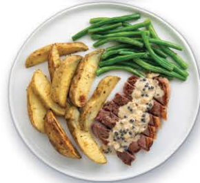
STEAK AU POIVRE 1,025 kg