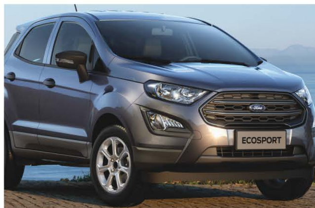
Le Ford EcoSport

90 % de son portefeuille ne sera constitué que de camionnettes, de VUS et de multiségments.