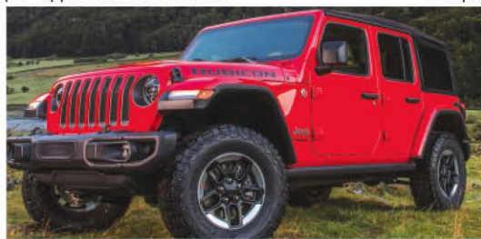
Le Jeep Wrangler

Celui-ci prend la forme d'un 4 cylindres 1,6 litre turbo de 125 chevaux et 115 lb-pi de couple avec une boîte de vitesses CVT. C'est la même combinaison boîte/moteur que l'on trouvait dans le Juke. Nissan annonce une consommation moyenne de 6,6 L/100km. Ce modèle fera la lutte au Chevrolet Trax, au Mazda CX-3 et au Toyota CH-R, pour ne nommer que ceux-là.