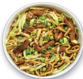
SAUTÉ DE PORC ÉPICÉ 1,415 kg