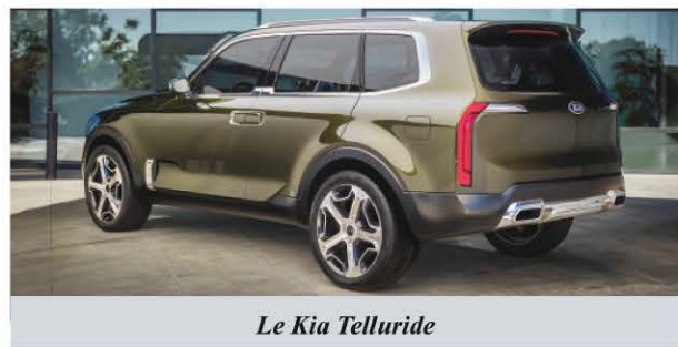
Le Kia Telluride

le V6 3,3 litres de 290 chevaux. Le moteur turbo offert, pour sa part, est diesel. Il s'agit de la même mécanique que dans le Hyundai Santa Fe. Avec en banque 200 chevaux et 326 lb-pi de couple, il ne manque pas de souffle et consomme moins de 8 litres aux 100 km de moyenne.