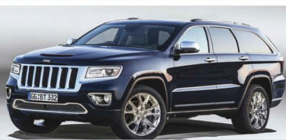
Le Jeep Grand Wagoneer 2019

On surveille 2 modèles chez Nissan cet automne. Il y a d'abord l'Altima, qui présente une toute nouvelle génération de berlines intermédiaires. Cette nouveauté tombe à point après le renouvellement de la Toyota Camry et de la Honda Accord, 2 de ses principales concurrentes. On remarque aussi plusieurs changements pour l'Altima, qui offrira entre autres pour la première fois une transmission intégrale en option. Sous le capot, Nissan insérera le moteur 4 cylindres à compression variable qui a été utilisé dans l'Infiniti QX50. Ce moteur 2,0 litres turbo développera 248 chevaux et 273 lb-pi de couple avec un ratio de compression pouvant passer de 8:1 à 14:1, favorisant ainsi la performance ou l'économie de carburant selon le type de conduite adopté par le conducteur. Le moteur 4 cylindres 2,5 litres demeurera la mécanique de base, avec une puissance ajustée à 188 chevaux. Nissan a en outre annoncé une légère hausse de prix par rapport au modèle 2018.