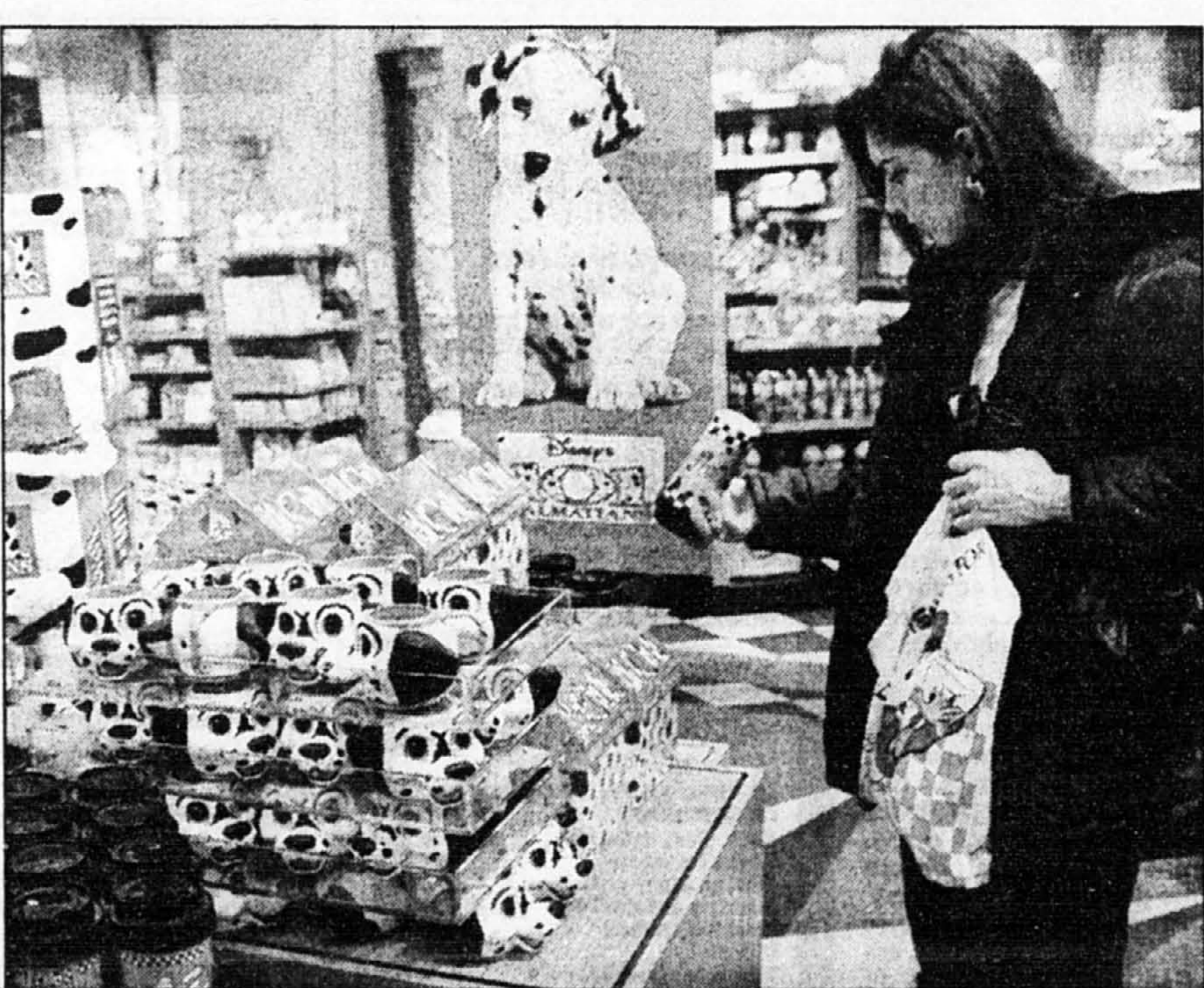
Une cliente du magasin Disney de Times Square, à New York, examine un des dalmatiens de peluche qui ont envahi le marché, hier, jour du lancement du film Les 101 dalmatiens .

Mais un petit dalmatien coûte cher, de 300 à 700 $, et les experts sont unanimes à dire qu'il n'est pas forcément le chien le mieux adapté à des familles citadines. « Je ne les recommanderais pas pour une famille avec des enfants de moins de cinq ans », confirme un éleveur d'Owings Mills (Maryland), soulignant leur propension à bouculer les tout-petits et à détériorer le matériel, ainsi que leurs défauts génétiques: