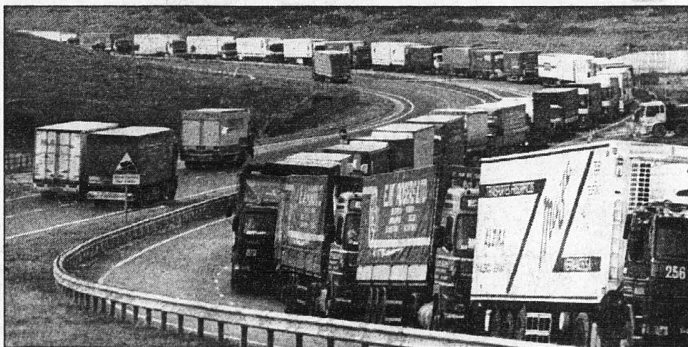
Outre-Manche, à l'approche du port de Douvre, des camions font la queue en attendant un ferry qui les conduira en France, où les routiers bloquent le trafic.

L'accord qui se dessine pourrait cependant fragiliser encore davantage un premier ministre très impopulaire, selon certains quotidiens. Il confirme en effet aux yeux des syndicats qu'une répétition de la grande crise sociale de novembre-décembre 1995 reste la grande hantise pour le gouvernement et qu'il est prêt à tout faire, même en prenant des libertés avec sa philosophie politique, pour éviter leur répétition.