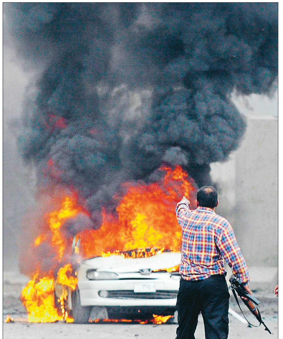
Un policier irakien regarde flamber une auto après l'explosion d'une voiture piégée près de l'hôtel Bagdad dans la capitale irakienne. L'attentat de dimanche a fait huit morts et au moins 32 blessés.

Une dizaine de jeunes soldats casqués et portant des gilets pare-balles sous leurs uniformes, montaient la garde, mitrailleurs pointés dans toutes les directions. Suant dans son khaki sous un soleil de feu, l'un d'eux sirotait une boisson gazeuse rose à même la grosse bouteille en plastique. Un autre, les yeux écarquillés à l'extrême sous son lourd casque, le doigt sur la détente, était à