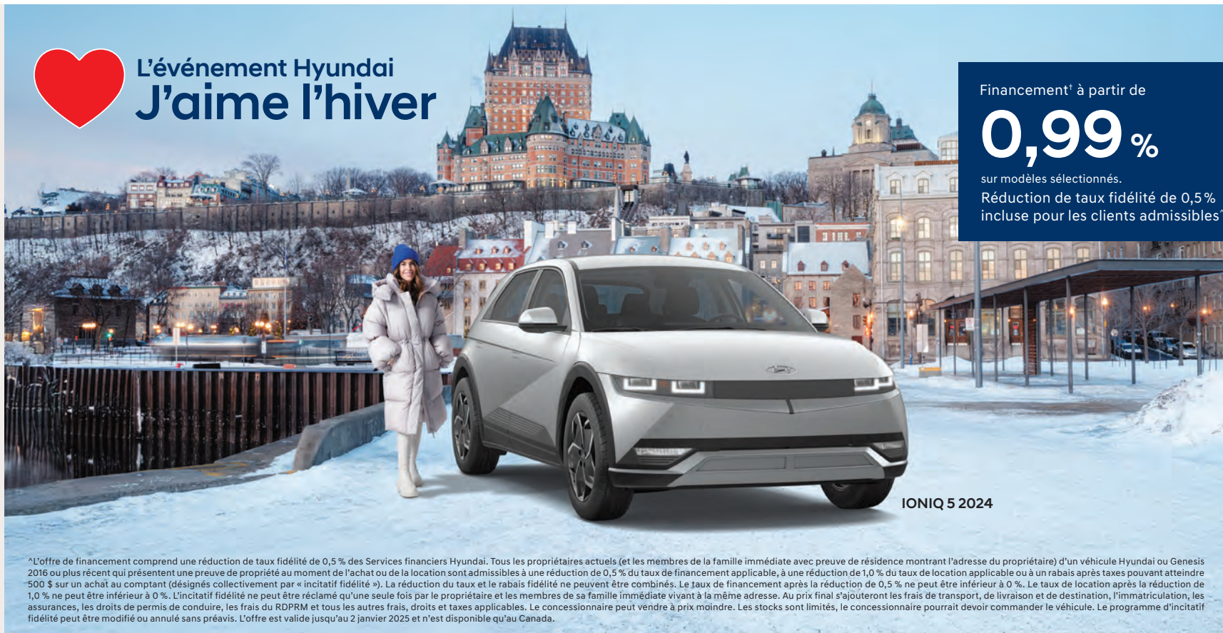
IONIQ 5 2024

Réduction de taux fidélité de 0,5% incluse pour les clients admissibles*.