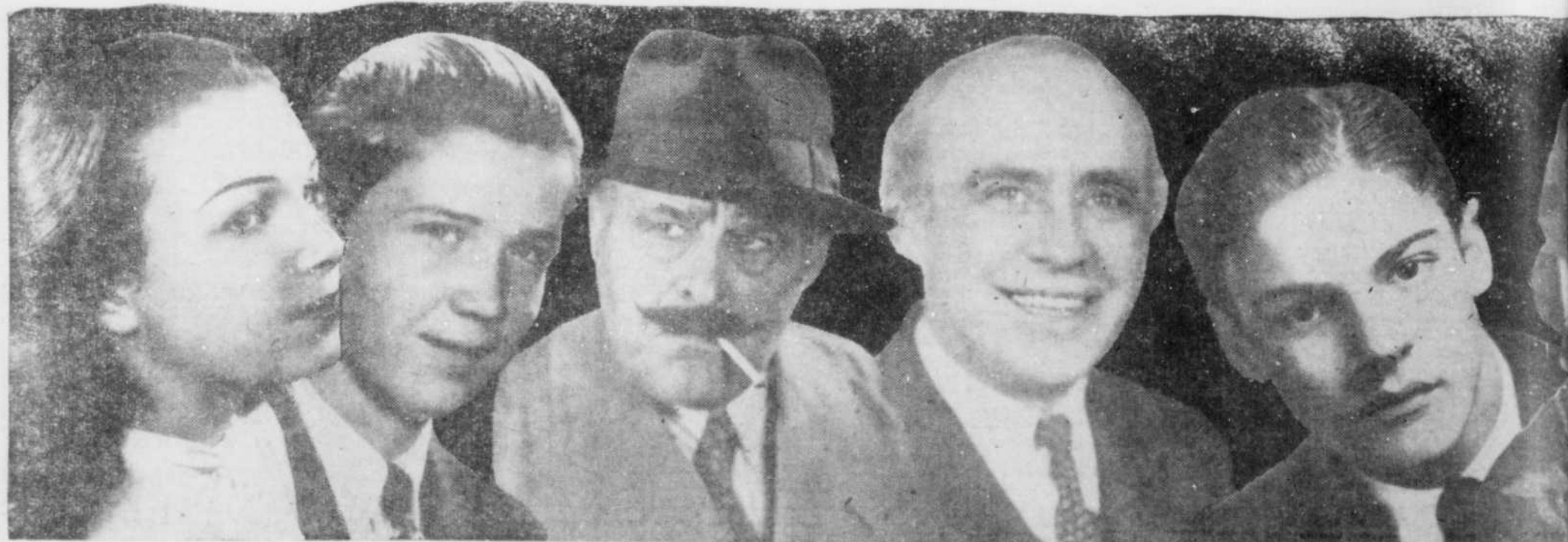
Marie-France Monique Leyrac