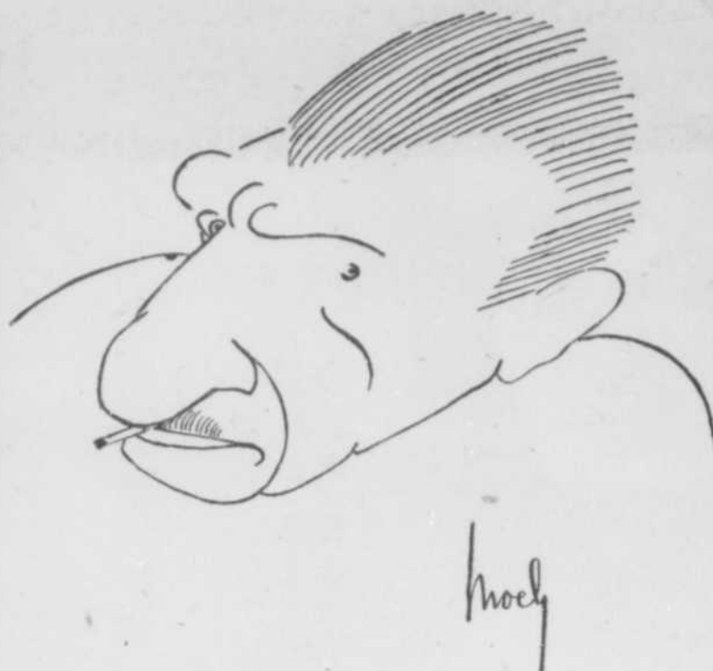
SERAPHIN vu par MOCH