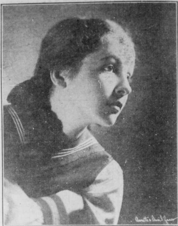
GINETTE LETONDAL, vedette de la radio, du théâtre et du cinéma, qui fera ses débuts comme danseuse de ballet, au Monument National, les 29 et 30 mars, au cours des représentations du "Petit Ballet", dirigé par Maurice Lacasse-Morenoff.

934 est, rue Ste-Catherine, suites 116-117, Montréal. Téléphone: LAncaster 5236.