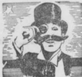
— PAR — L'ACADEMICIEN

Enfin, voilà l'Printemps! Après la neige, c'est le dégel; consolons-nous en pensant aux trois mois d'été et à nos prochaines vacances de deux semaines dans un site laurentien . . . Tout de même, il y aura encore de beaux moments d'ici là. Ainsi, le Dîner-Danse-Gala Annuel nous permettra d'oublier les mille et un tracas quotidiens . . . Et, l'époque pascale, avec ses fleurs et sa verdure, rajouera quelque peu les visages des contemporains qui pensent au fisc . . . Pour sûr, "La Forteresse", de Quebec Productions, aura sa première mondiale dans un avenir rapproché. Et, tous nos compatriotes seront orgueilleux du succès de cette entreprise canadienne . . . Voilà que Lord Oh! Oh! nous a fait remettre une "jaquette" autographiée à un groupe de citoyens "modestes". Pourvu que ces braves ne décident pas de porter en bannière cet élégant vêtement, tout ira bien . . . Aux Etats-Unis, on appelle "disk-jockeys" les animateurs d'émissions nocturnes qui poirotent avec les enregistrements musicaux. Chez nous, on a mieux: des annonceurs qui réalisent et commentent, seuls, six programmes successifs à des heures parfaitement légitimes . . .