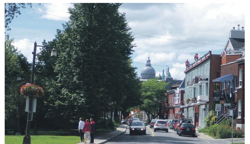
LE BOULEVARD SAINT-JOSEPH, À LACHINE, AVEC LE DÔME DU COLLÈGE À L'ARRIÈRE-PLAN

En 1872, Lachine est incorporée en ville. Avec le temps, elle accentue son rôle de banlieue par le développement immobilier pour pallier la fermeture du canal en 1959. En plus d'être parvenue à développer une économie plus diversifiée, elle profite du récréotourisme depuis la réouverture du canal à la navigation de plaisance en 2002. Aujourd'hui, Lachine, forte de ses quelque 42 000 habitants, constitue un arrondissement de Montréal, dirigé par le maire Claude Dauphin.