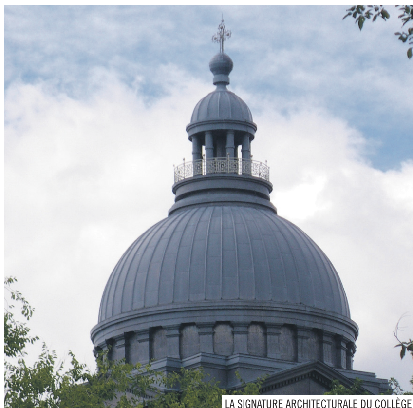
LA SIGNATURE ARCHITECTURALE DU COLLÈGE

Les projets se multiplient toujours à haute vitesse. Ainsi, alors qu'on prépare l'arrivée du Collégial Sainte-Anne, on jongle aussi avec d'autres idées avant-gardistes... Tout est donc en place pour permettre à Sainte-Anne de rester un chef de file dans l'éducation au Québec.