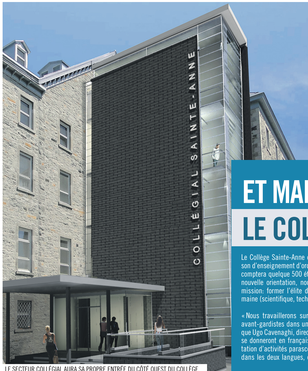
LE SECTEUR COLLÉGIAL AURA SA PROPRE ENTRÉE DU CÔTÉ OUEST DU COLLÈGE

En 2011, Sainte-Anne tiendra un congrès international avec ses écoles partenaires pour souligner son 150 e anniversaire et démontrer son orientation internationale.