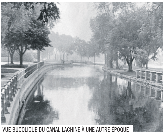
VUE BUCOLIQUE DU CANAL LACHINE À UNE AUTRE ÉPOQUE

Les années 2000 s'ouvrent sur des programmes audacieux, comme DéfiMonde, DéfiSports et l'Académie Sport et Art Élite. Plus récemment, le Collège amorçait un sérieux virage informatique lui permettant de révolutionner ses stratégies d'apprentissage en implantant l'i-classe. Enfin, en août 2011, Sainte-Anne écrit une nouvelle page de son histoire en ouvrant, dans le couvent que les Sœurs lui cédaient au printemps 2010, la seule maison d'enseignement collégial privée de l'ouest de l'île de Montréal.