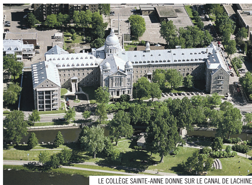
LE COLLÈGE SAINTE-ANNE DONNE SUR LE CANAL DE LACHINE

Comme les Sœurs à l'époque, le Collège conjugue le verbe « oser » régulièrement. Ainsi, depuis quelques années, il ne cesse d'innover pour préparer ses élèves à la communauté internationale, puisque le travail n'aura plus de frontières. Il l'a fait en implantant son programme DéfiMonde, en imprégnant l'école d'autres cultures, en devenant une école associée de l'UNESCO, en tissant un réseau d'écoles partenaires, qui favorise