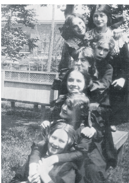
PHOTO PRISE PAR UNE ÉLÈVE, PENSIONNAT SAINTE-ANNE, LACHINE, 1914-1915

Pour le cinéaste, ce projet est aussi une «expérience de création collective impliquant les élèves, les éducateurs et les cinéastes professionnels de Via le Monde», sa maison de production. Deux équipes d'élèves ont été mises sur pied pour participer à ce documentaire: une équipe de recherche élabore depuis plusieurs mois l'histoire du Collège et une équipe de tournage montera des archives vidéo des principales activités au Collège.