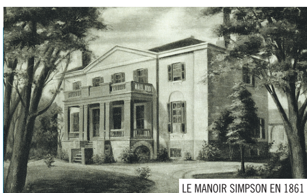
LE MANOIR SIMPSON EN 1861