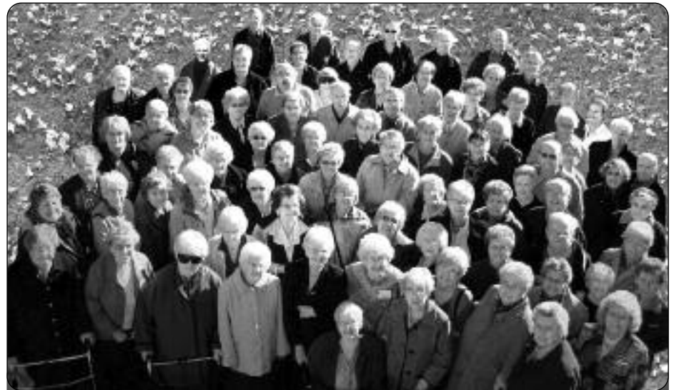
Les membres de La Ballade des gens heureux de Saint-Jean-sur-Richelieu ont fêté le 20e anniversaire de l'organisme en mai dernier.

Depuis 2002, la Ballade collabore avec la Maison du Père de Montréal en tricotant des bas, des mitaines et des pantoufles pour les itinérants.