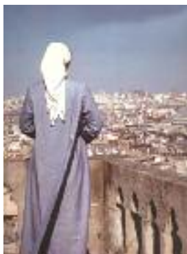
Fraternité monastique de Jérusalem

Un autre pèlerinage est prévu du 22 au 24 avril 2010. Réservez vos places dès maintenant.