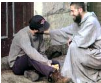
Les Franciscains de l'Emmanuel