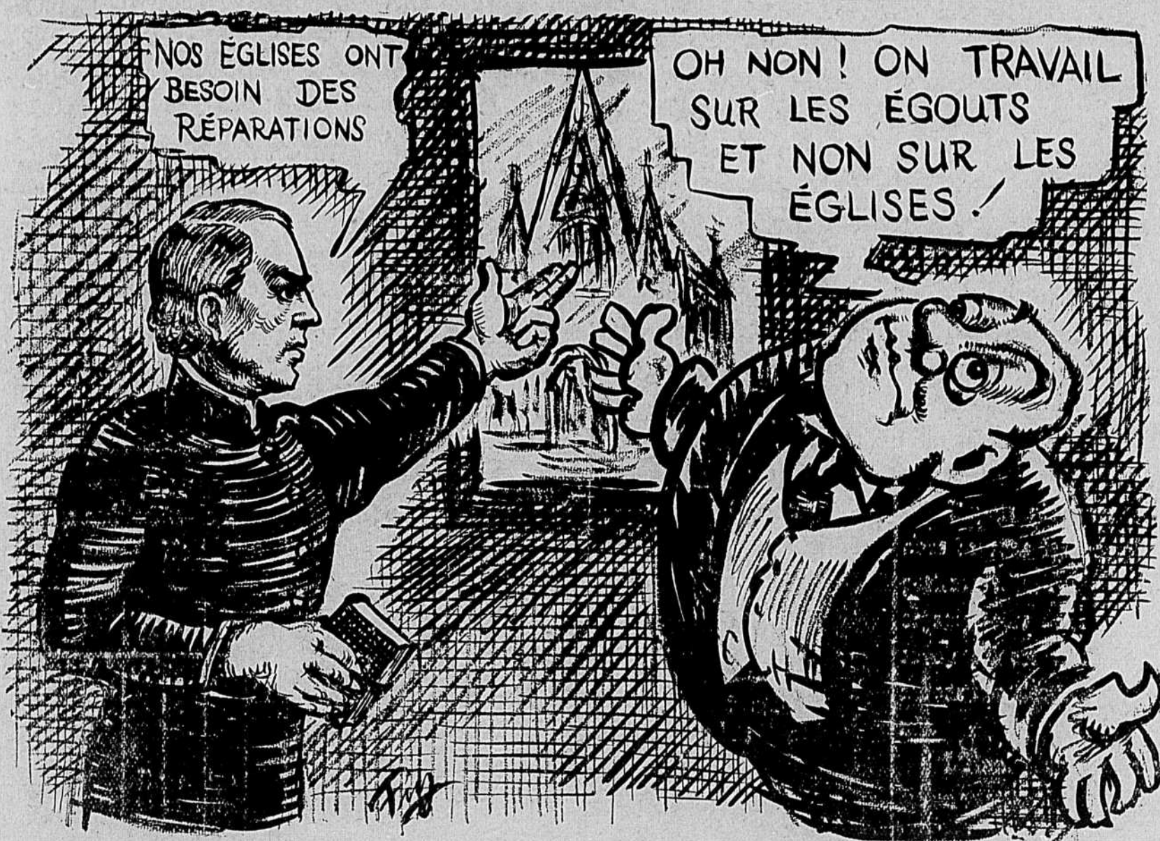
Nous ne construisons pas de temples. Nous les détruisons !

LISEZ L'AUTORITÉ NOUVELLE EN VENTE PARTOUT