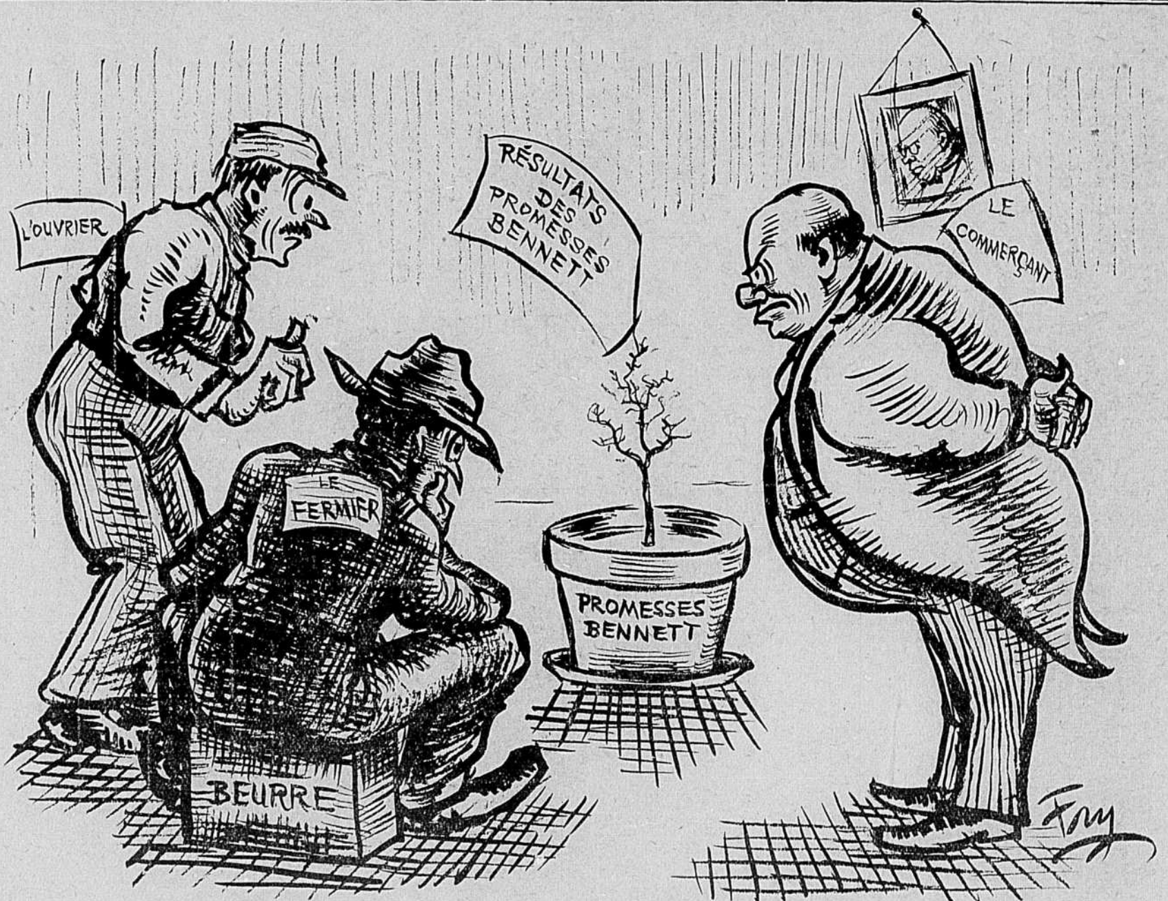
Les résultats et les promesses du gouvernements Bennett