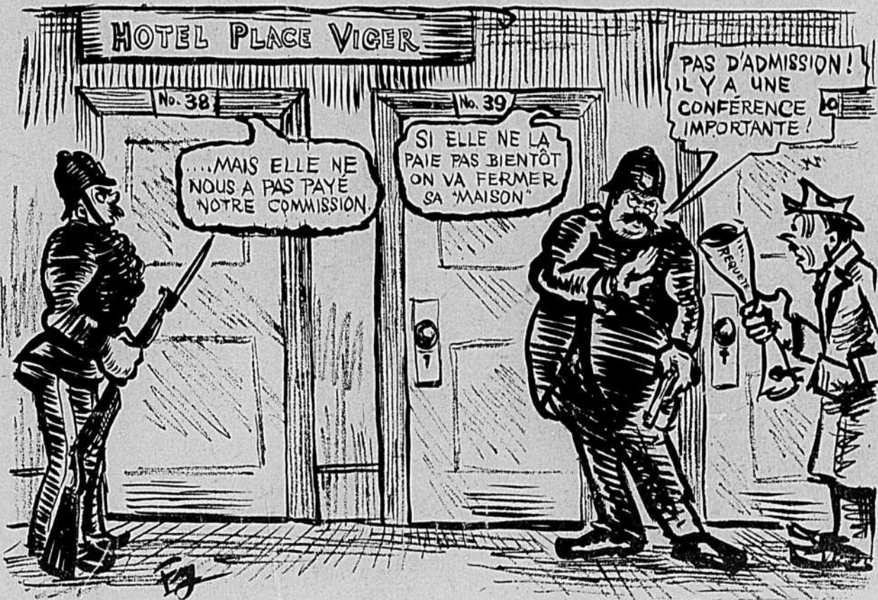
La scène se passe au Château Viger, à Montréal.