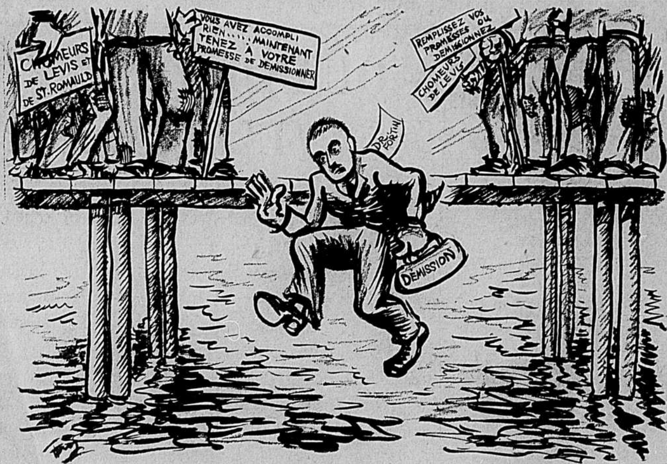
Le Député de Lévis dans un moment de désespoir.