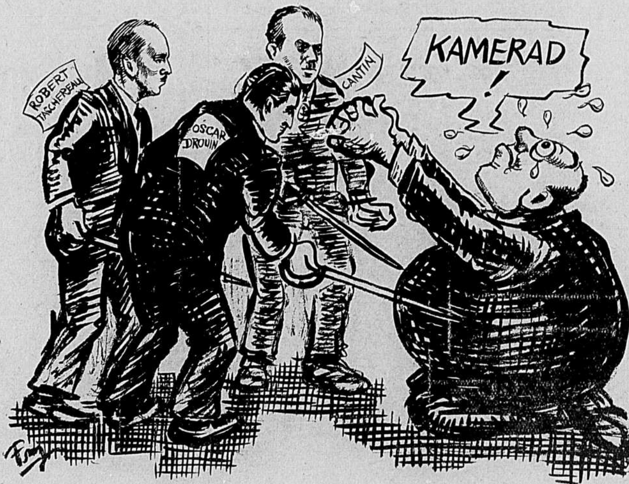
Les amis à l'attaque de l'ennemi.