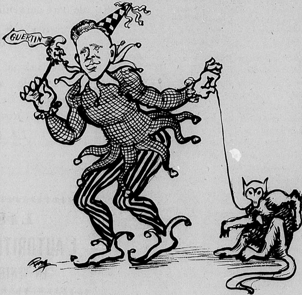
Le Député de Hull en promenade dans son comté.

Voyons, le chômage l'a-t'y réglé? Tout ce qui a faite,