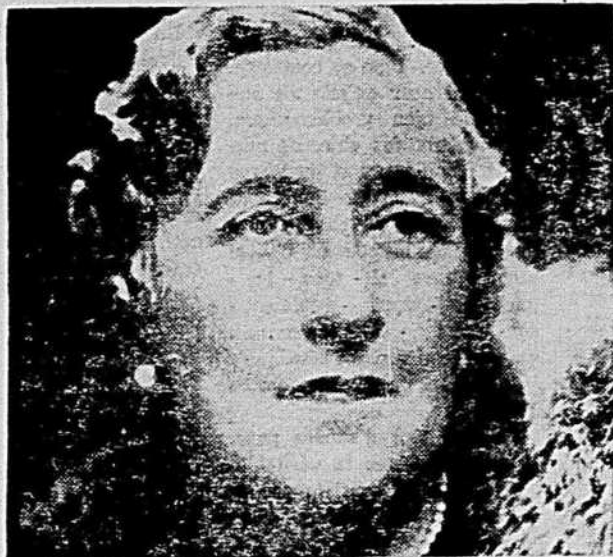
Agatha Christie à 63 ans. Trois pièces de sa confection sont à l'affiche simultanément...

LONDRES (AFP) — "Huit jours après qu'elle eut quitté son domicile de Sunningdale dans des circonstances inexplicables, le mystère posé par la disparition de Mme Agatha Clarissa Christie demeure entier. La police a toutefois pu recueillir quelques indices. On sait maintenant avec certitude que la jeune femme qui a arrêté en pleine nuit un fossoyeur local pour qu'il l'aide à remettre sa voiture en marche n'était autre que l'écrivain disparu. Cette voiture devait d'ailleurs être retrouvée abandonnée sur une route de campagne. A l'intérieur, des vêtements de femme gisaient épars sur le sol. Depuis, toute trace a été perdue. Et la question se pose, angoissante: y a-t-il eu fugue, crise d'amnésie, ou... crime?"