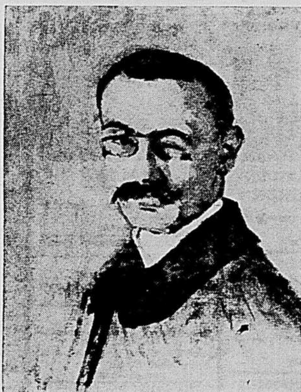
Portrait de l'artiste par lui-même, toile, 1904

Et ces petits dessins insignifiants... non, vraiment. Le bout du monde!