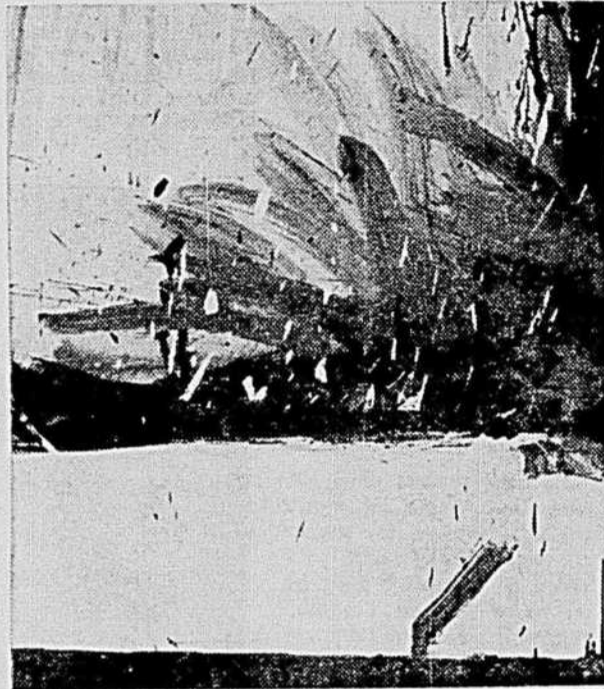
"Août, P.M. II" 1963