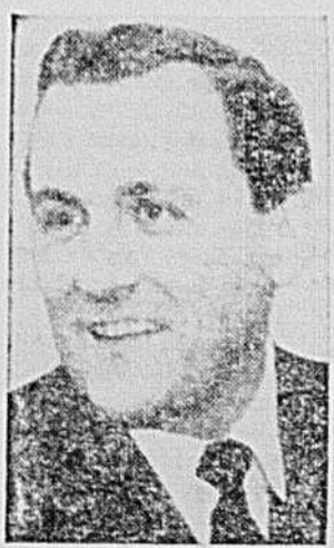
JOERG DEMUS, pianiste, inaugurera la seconde partie de la présente saison du Ladies' Morning Musical Club, jeudi prochain.