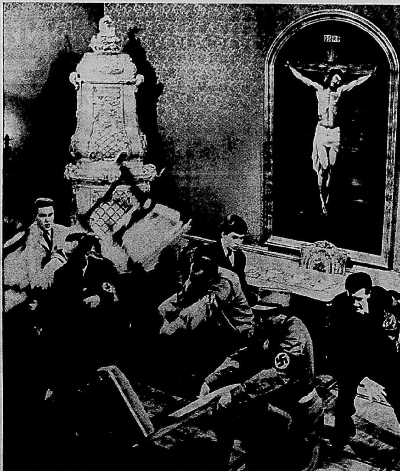
Une scène de "The Cardinal": le saccage de l'épiscopat de Vienne par les Nazis

A propos des auteurs dits de "nouvelle vague", le metteur en scène du "Cardinal" déclarait récemment: "Ce qu'ils réussissent à faire est admirable parce que, s'ils avaient de l'argent, leurs films seraient probablement très conventionnels..." Auriez-vous trop d'argent, M. Preminger?