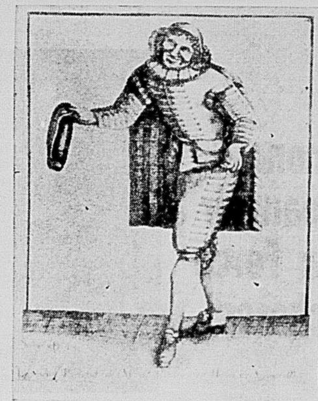
Molière acteur (gravure de Simonin)

Il s'attaquera désormais à forte partie et sa vie deviendra